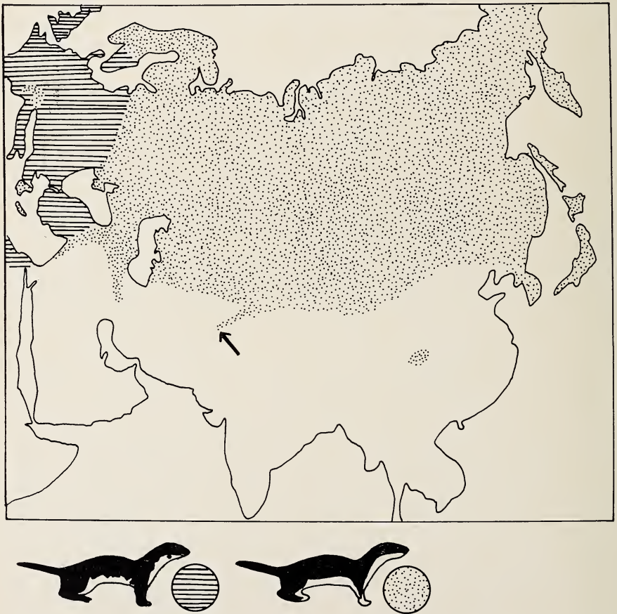
Abb. 1: Die Verteilung der beiden Zeichnungstypen des Sommerfells bei Mustela nivalis ; schraffiert nivalis -Typ, punktiert minuta -Typ. Grundlagen: Sammlungsmaterial des British Museum of Natural History, London, und des Museums A. Koenig sowie der Literatur. Pfeil: Afghanistan.

a) Sommerkleid (Abb. 1). Man kann zwei Hauptmuster unterscheiden, die in Abb. 1 skizziert und in ihrer Verbreitung dargestellt sind: