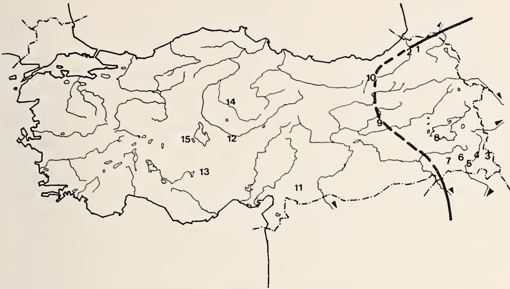
Abb. 2: Oenanthe pleschanka