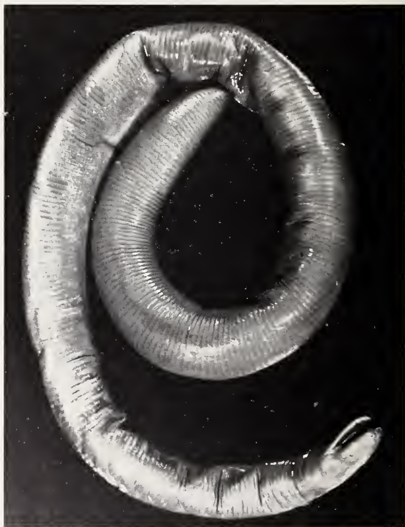
Fig. 1: Ichthyophis bernisi n. sp. Aspecto dorsal del holotipo.

Procediendo actualmente a la revisión y catalogación de la colección herpetológica del Museo Nacional de Ciencias Naturales del CSIC, hemos localizado un ejemplar del género Ichthyophis Fitzinger, 1826, que dada la rareza de estos animales en las colecciones hemos procedido a su examen y