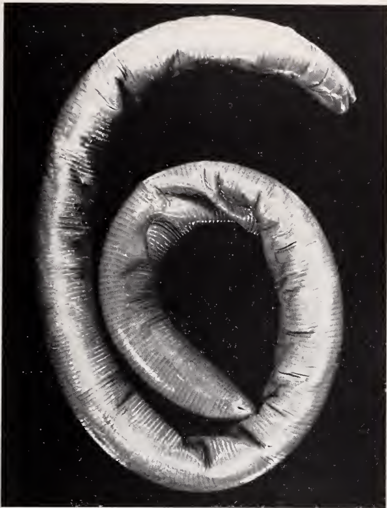
Fig. 2: Ichthyophis bernisi n. sp. Aspecto ventral del holotipo.