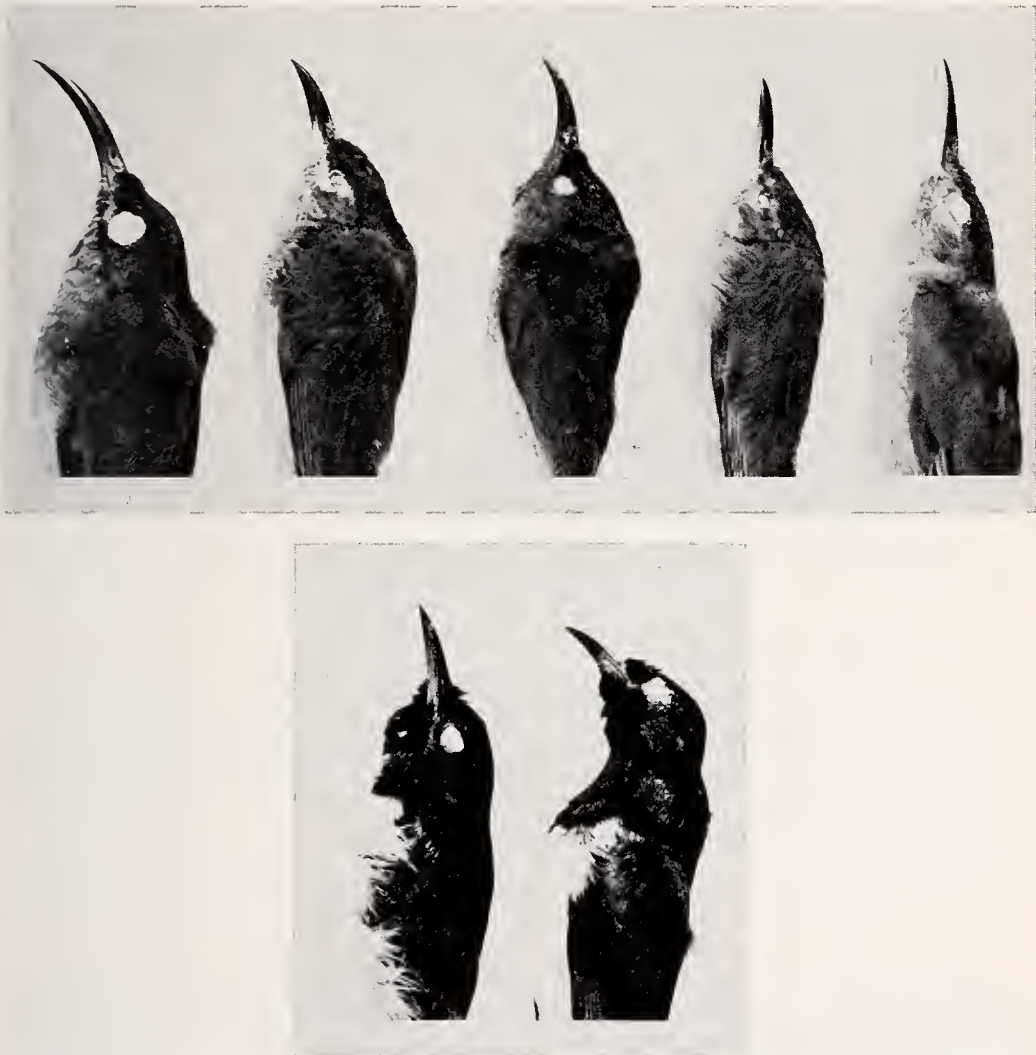
Abb. 2: Schnabelform einiger Nectariniiden. Obere Reihe (von links nach rechts): Haagneria olivacea sclateri , Paradeleornis batesi , Haplocinnyris ursulae , Paradeleornis seimundi seimundi , Deleornis fraseri cameroonensis . Untere Reihe: Links Lamprothreptes longuemarei nyassae , rechts: Hedydipna metallica .

Eine durch Schnabelform und Gefiederfärbung und -zeichnung gut charakterisierte Gattung: Schnabel kräftig, verhältnismäßig lang, Oberschnabel leicht gebogen, Unterschnabel gerade; Gefieder ♂ oberseits mehr oder weniger violettblau, z. T. auch grün schillernd, Kehle ebenso, Unterkörper weiß oder gelbbraunlich mit auffallenden Brustbüscheln; ♀ ungefleckt, Gefieder mit etwas oder ( L. aurantium ) mit viel Metallglanz. Ziemlich große Nectariniiden (Flügel bis 81 mm). L. pallidigaster ist kleiner und gehört vielleicht in ein besonderes Subgenus; ich konnte diese Art,