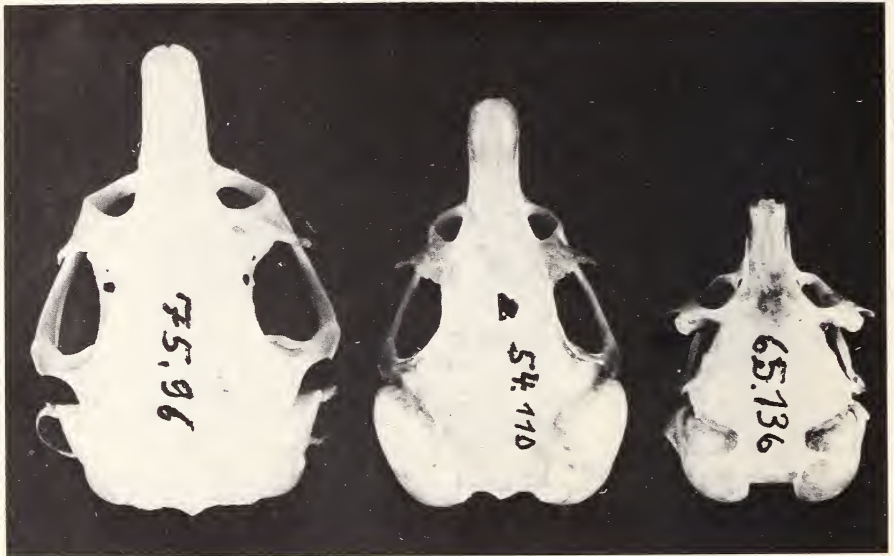
Abb. 1: Schädel in Aufsicht von (v.l.n.r.) Ctenodactylus gundi , Massoutiera mzabi und Jaculus jaculus .