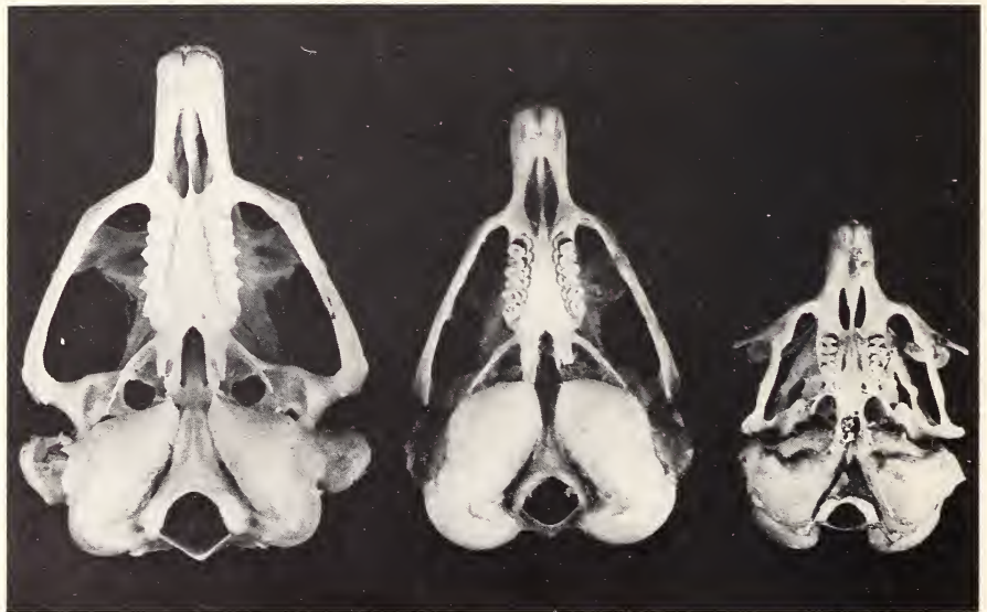
Abb. 2: Die gleichen Schädel von der Gaumenseite (ohne Mandibeln)