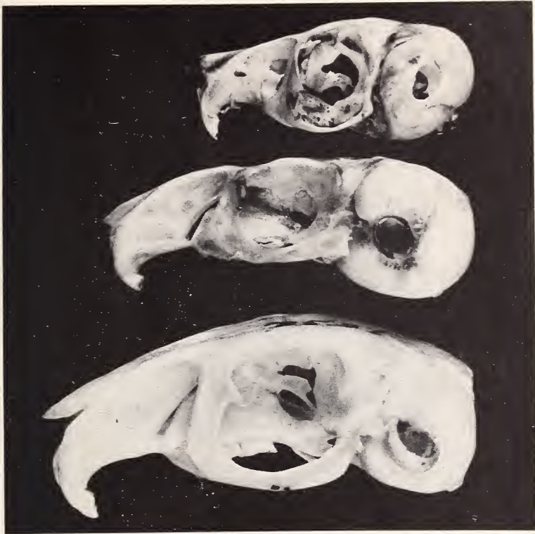
Abb. 3: Die gleichen Schädel (v.u.n.o.) im Profil.