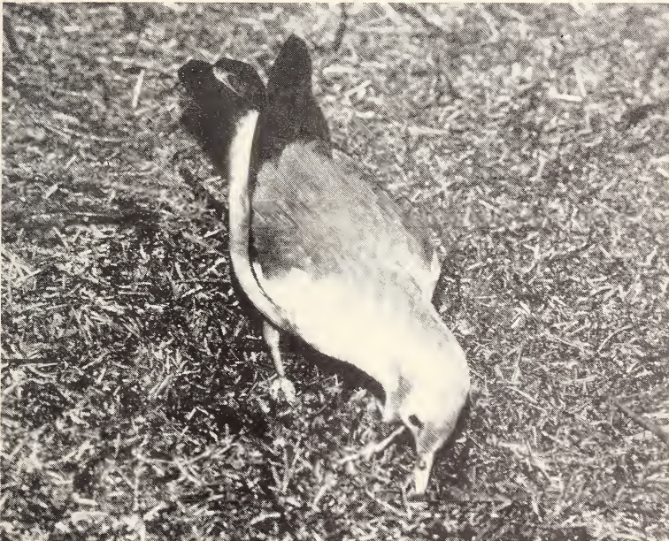
Abb. 2: Ein Lappenstar beim Zirkeln.

Das Zirkeln ist unter den Sturniden weit verbreitet, fehlt aber den Glanzstaren und Beos (Neweklowsky 1972). Kramer (1930) sah es beim Lappenstar; das kann ich bestätigen. Mit dem Zirkeln sucht der Lappenstar nach geeigneter Nahrung (Abb. 2). Dabei steckt er den geschlossenen Schnabel ins Substrat und spreizt darin die Schnabelhälften auseinander.