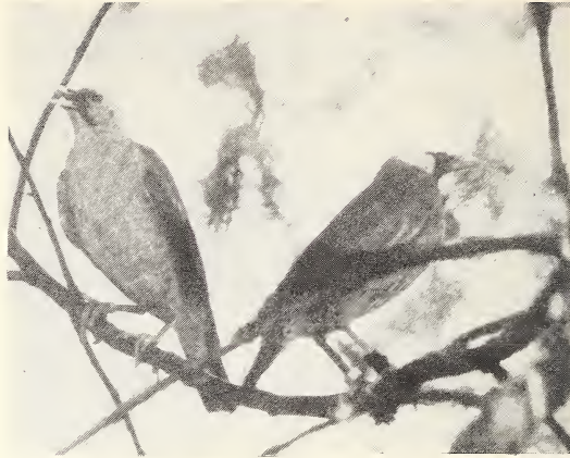
Abb. 4: Verhalten bei Hitze: angelegte Körperfedern, „gelupfte“ Flügel, auseinanderklaffender Ober- und Unterschnabel (linker Vogel).

Körperhaltung nicht folgen. Umgekehrt ist sie nicht an ein vorausgehendes Sonnenbad gebunden, sondern wird allgemein an heißen Tagen beobachtet.