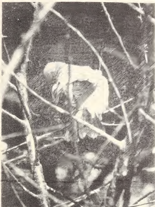
Abb. 3: ♂BBl nimmt im Geäst ein Sonnenbad.

Sonnenbäder nehmen sie auf dem Boden und im Geäst (Abb. 3)