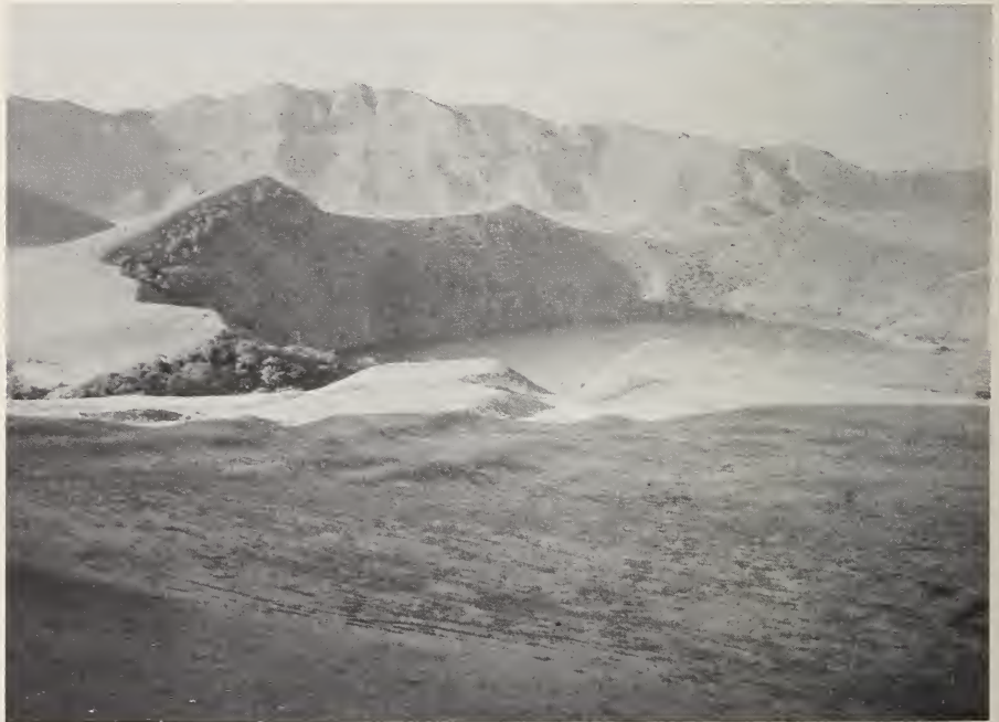
Abb. 2: Blick auf den Großen Manenguba-See. In der Uferzone des Sees wurde Crocidura manengubae n. sp. gefangen. Foto: M. Eisentraut, 1966.

Maße des Holotypus (und des Paratypus). — Kopf-Rumpflänge 87 (77), Schwanzlänge 61 (62), Hinterfuß 16 (16), Ohr 11 (9), Gewicht 15 (13) g; Condylolincisivlänge 22.1 (21.5), Palatinumlänge 9.1 (8.4), Maxillare Breite