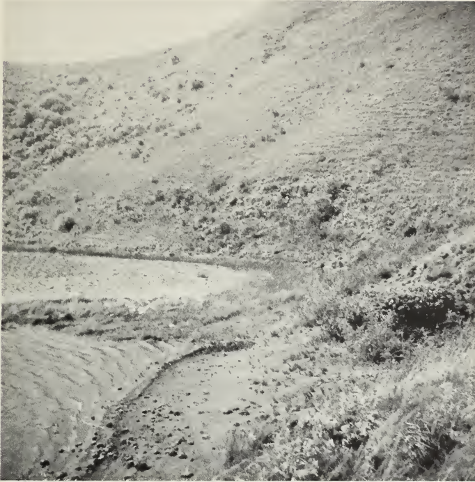
Abb. 3: Gras- und buschbestandener Südhang des Großen Manenguba-Sees. In der versumpften Uferzone ein Schwarm Reiher. Foto: M. Eisentraut, 1966.

6.3 (6.1), Interorbitale Breite 4.7 (4.8), Größte Schädelbreite 9.5 (9.3), Länge der oberen Zahnreihe 9.4 (9.1), Länge der unteren Zahnreihe 8.5 (8.2), I^2-I^2 (external) 2.2 (2.2), M^2-M^2 (external) 5.9 (5.8), Koronoidhöhe 5.0 (4.6).