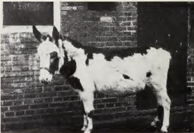
Abb. 2: Esel aus Marwede mit Scheckungsmuster südamerikanischer Pferde.

Wie ich schon 1951 erwähnte, ist das Scheckungsmuster beim Esel abweichend von dem der dominanten und der rezessiven Pferdescheckung in Europa; es erinnert in manchen Fällen eher an die Buntheit amerikanischer Pferde („overo“ und „sabino“, Abb. 2). Äußerlich stellt sie gewissermaßen das Negativ unserer bekannten dominanten Pferdescheckung dar, weil gerade die Körperregionen, die beim dominanten Pferdescheck in erster Linie weiß, d. h. albinotisch sind (also auch bei sehr dunklen, ausgefärbten Pferden), beim Esel, auch bei hochgradig aufgehellten Schecken, noch Reste von Pigment zeigen (Aalstrich, Schulterkreuz). Die Abbildungen 3 und 4 bringen