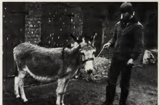
Abb. 9 (links): Helles Rotschimmelfohlen mit großer, unregelmäßiger Blesse (von Scheckhengst mit viel Weiß und dunkelbrauner Stute, Gestüt Schalke). Abb. 10 (rechts): Grauschimmelstute mit angedeuteter Scheckung (Inzucht auf Costa).