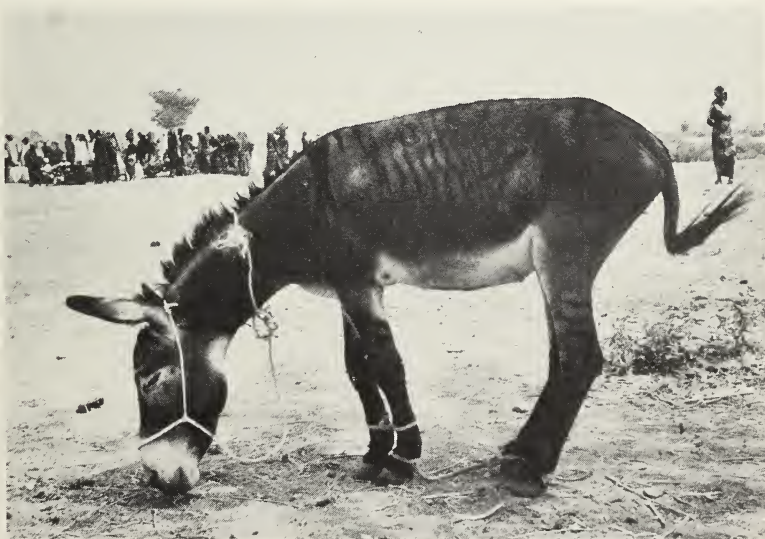
Abb. 1: Eselzebroid (Zebrinny) aus Maroua, Kamerun (Foto: Böhme).

Der Jubilar, dem dieses Heft gewidmet ist, zeigt in seinem Buch über Kamerun u. a. auch einen merkwürdig gestreiften Einhufer, der dort als Esel bezeichnet wird. Das Tier zeigt die verdunkelte (dunkelbraun bis schwarze) Grundfarbe mit dem weißen Mehlmaul, der weißen Kehle und dem weißen Bauch, die heute wohl überall ebenso häufig auftritt wie die graue (eselsgraue) Farbe. Mit den relativ langen Ohren und den Körperproportionen unterscheidet er sich nicht von einem Hausesel mittlerer Größe. Das Abweichende und Auffällige ist aber die Streifung, die an einigen Stellen trotz der dunklen Grundfarbe sichtbar wird (Abb. 1). Es sind einige (vorn 2-3, hinten 5-6) dunkle Querstreifen oberhalb der Vorderfußwurzel und der Ferse und eine ganze Reihe relativ schmaler Bänder, die, vom starken und in