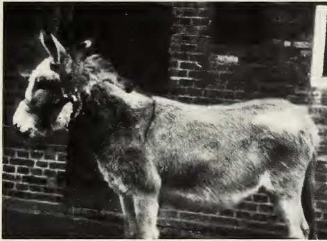
Abb. 11: Aus Istrien eingeführte Stute mit geringer Weißzeichnung (Marwede).

Man könnte diese geringe Aufhellung der einen Stute ganz übersehen und unbeachtet lassen, wenn nicht diese beiden Schwestern 1981 von dem rechten Bruder, dem Schecken Costa, zwei ganz oder fast ganz weiße Fohlen gebracht hätten (Abb. 6), die ohne jeden Zweifel homozygote, extrem