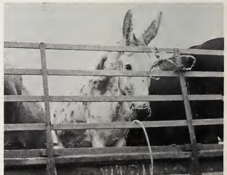
Abb. 12 (links): Getigertes Einhufer aus Andalusien.