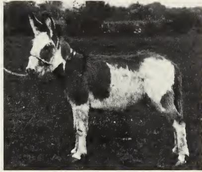
Abb. 3 (links): Typisches Scheckungsmuster europäischer Pferde (zweijähriger Hengst Nymphensittich von Originallipizzaner Bajazzo-Pluto, Gestüt v. Lehmann-Mathildenhöh).