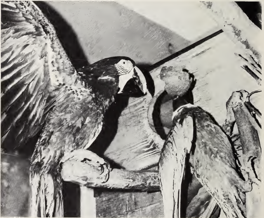
Abb. 3: Spiel mit der Kokosnußschale

Unbekannten Dingen gegenüber, die wir dem Ara-♂ anboten, verhielt es sich ängstlich. Es überließ dem zahmen und nicht mißtrauischen ♀ das Abnehmen und prüfende Betasten, und darauf bedrängte er seine Partnerin, ihm den Gegenstand zu überlassen. Einfach dem anderen das Spielzeug wegreißen, gab es bei den Aras so wenig wie bei den Keas (Keller 1975). Durch die aufdringliche Hartnäckigkeit gelangte er aber meistens sehr schnell zum Ziel. Von Kokosnußschalen trennte sich das ♀ nicht so leicht. Nach vielen vergeblichen Annäherungsversuchen zeigte das ♂ eine Serie von Imponierbewegungen und äußerte dazugehörige Rufe, auf die seine Partnerin überhaupt nicht reagierte. Sie wehrte ihn mit Fußtritten oder Schnabelschlägen ab, und schließlich schlug sie ihm mit der Kokosnußschale über den Schnabel. Wenn dann das ♂ dieses Spielzeug endlich erwischte hatte, wurde es ihm nach einiger Zeit über, und nun versuchte er das ♀ anzuregen, sich von neuem dafür zu interessieren (Abb. 3). Er rückte dicht an seine Partnerin heran und schwenkte den Gegenstand (die Kokosnuß-