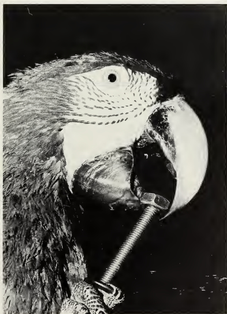
Abb. 2: Eine Mutter wird auf die Schraube gebracht

Begehrtes Spielzeug trugen die Aras lange mit sich herum, legten es beim Fressen in den Napf, um es darauf gleich wieder zu nehmen. Gelegentlich trug das ♂ alle Spielsachen auf das Dach des Brutkastens und legte sie dicht zusammen oder aufeinander: Schlüsselringe, Schrauben, Muttern, Flaschenöffner. Immer wieder suchte es sich eine Beschäftigung. Mehrmals