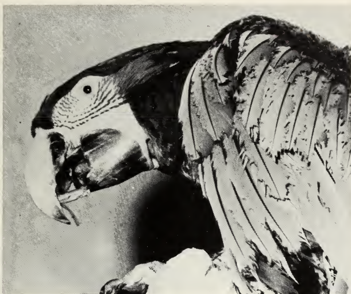
Abb. 5: Aufstellen des Hölzchens zur Reinigung des Unterschnabels

Schließlich benutzte das ♂ auch Blumendraht zum Reinigen des Schnabels. Beide nahmen auch ebenso wie die Kubaamazone und Hyazintharas oft etwas Rinde oder Blätter, die sie mit dem Unterschnabel knabbernd gegen die Feilkerben drückten.