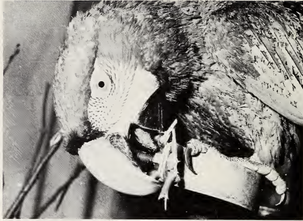
Abb. 1: Zuhilfenahme von Rinde beim Abdrehen einer Mutter

chenden Richtung, drehte der Vogel die Mutter ab. Nicht immer gelang es sogleich, die Verschraubung zu öffnen. In diesem Fall nahm der Ara ein Stück Rinde, einen Zweig, ein Blatt oder manchmal ein Steinchen und klemmte es zwischen den Unterschnabel und die zu lockernde Mutter (Abb. 1), ähnlich wie man selbst, um die Reibung zu erhöhen, ein Tuch zu Hilfe nimmt, wenn sich ein Gefäß schwer öffnen läßt. Diese Methode wandten beide Aras auch bei sehr hartschaligen Nüssen an.