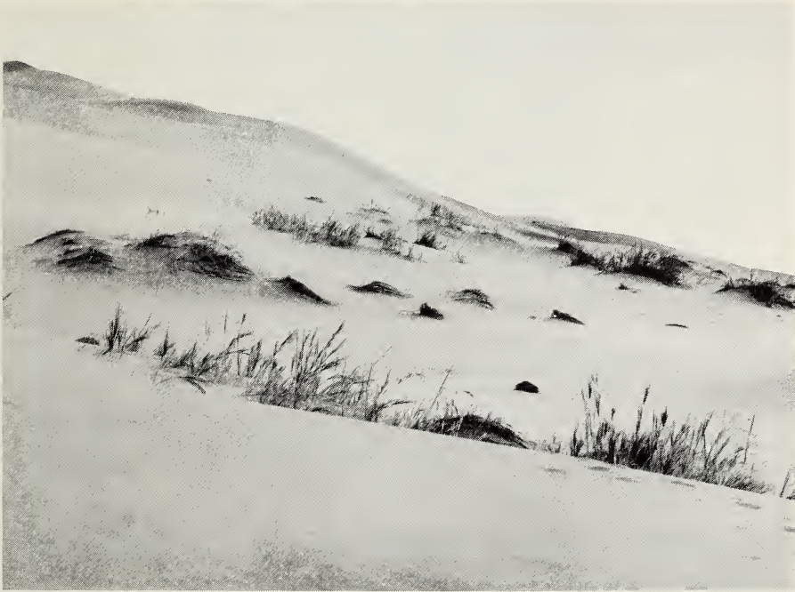
Abb. 2: Bevorzugter Biotop von Onymacris laeviceps mit Horsten der Graminee Stipagrostis sabulicola .

Die Untersuchungen an O. laeviceps beziehen sich auf ein wenige Kilometer von Gobabeb entferntes Dünenfeld, das von einer unmittelbar an den Trockenfluß angrenzenden Hochdüne ausgehend in etwa südlicher Richtung verläuft und sich nach dort allmählich absenkt. Dieses Dünenfeld wird im Osten und Westen von ebenen Steinflächen eingesäumt. Nach Westen zu erstreckt sich in etwa zwei Kilometer Entfernung parallel dazu ein weiteres Dünenfeld (Abb. 1). Charakterpflanze dieser Dünen ist die perennierende Graminee Stipagrostis sabulicola . Sie bildet solitäre, über 1 m hohe Horste und findet sich vorwiegend in den Senken zwischen den Dünenkämmen (Abb. 2). Die Blütezeit dieser Staude fiel in den Kontrolljahren in die Monate Februar—März.