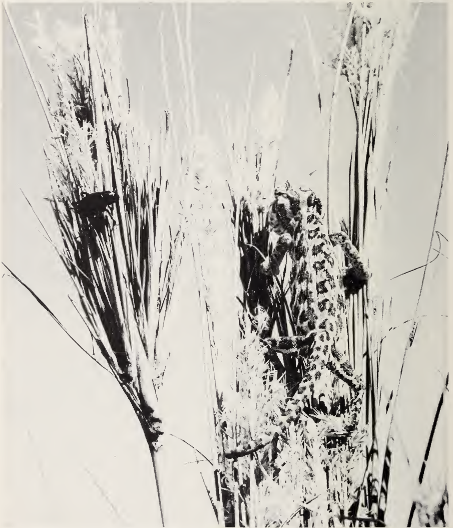
Abb. 5: Auf Beute lauernerndes Namib-Chamaeleon ( Chamaeleo namaquensis ) an Stipagrostis sabulicola .

Imagines von laeviceps erbeutet auch das Namib-Chamaeleon ( Chamaeleo namaquensis ) (Abb. 5). Während der Stipagrostis -Blüte traf ich einzelne Tiere auf Beutefang in den oberen Pflanzenteilen zwischen den ihren Reifungsfraß durchmachenden laeviceps -Käfern an. Allerdings ist Ch. namaquensis im Kontrollgebiet keineswegs häufig anzutreffen, so daß ihm hier populationsdynamisch wohl keine entscheidende Bedeutung beigemessen werden kann (Holm & Scholz 1980).