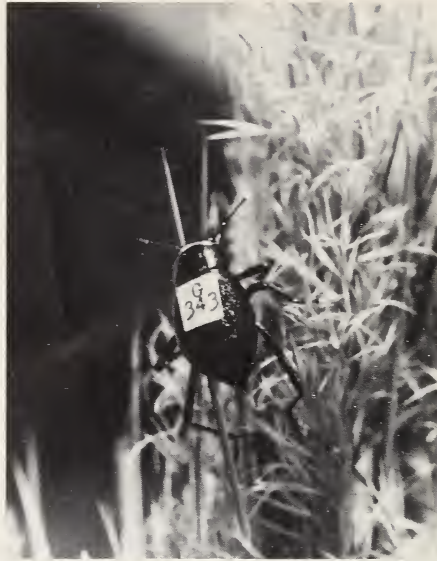
Abb. 3: Gekennzeichnetes laeviceps -Weibchen an einer Blütenrispe.

suchstiere und 2. Ausgraben der inaktiven Käfer aus dem Sand. Auf die Benutzung von Bodenfallen wurde verzichtet, weil laeviceps -Weibchen infolge geringerer Laufaktivität gegenüber den Männchen in Bodenfallen stark unterrepräsentiert sind.