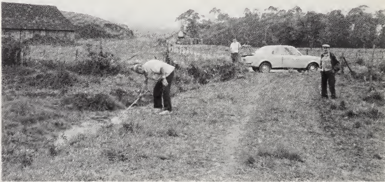
Abb. 4: Stark verkrauteter Entwässerungsgraben zwischen Reisfeldern, in dem ein einzelnes Exemplar von Rivulus luelingi gefangen wurde.

In einem stark verkrauteten Abflußgraben nur wenige Kilometer von der Wiesenenke entfernt (Abb. 4) fing ich 1980 einen einzigen Rivulus luelingi . In diesem Graben wurde darauf in beiden Jahren sehr intensiv gekeschert, aber kein weiteres Exemplar erbeutet.