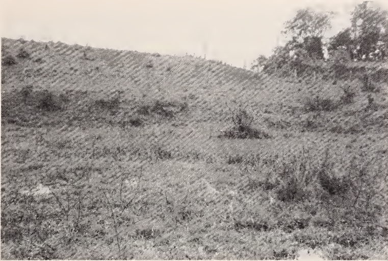
Abb. 3: Die grasdurchwucherte Regenwassersenke, Biotop von Rivulus luelingi , Ende September 1980. An vielen Stellen ist deutlich das opale, in einigen Bereichen auch graugelbliche Flachwasser zu sehen.