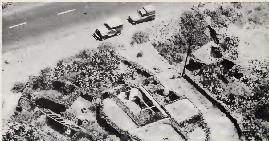
Fig. 4: Antiguo poblado de Guinea, al pie de la Fuga de Gorreta, zona destinada al complejo histórico-arqueológico.

Con esta finalidad se concibe integrar la unidad de cría y el laboratorio 4 en un complejo múltiple que está en proyecto de desarrollarse al amparo de la creación de la Reserva Integral de Salmor y Gorreta. La unidad de cría se dotará de una sección abierta a las visitas, donde se podrán mostrar algunos lagartos y recibir información sobre el propio Plan de Recuperación y sobre la interesante fauna de reptiles de Canarias. Asimismo, se prevé la instalación de una unidad de interpretación sobre la historia natural de la isla del Hierro.