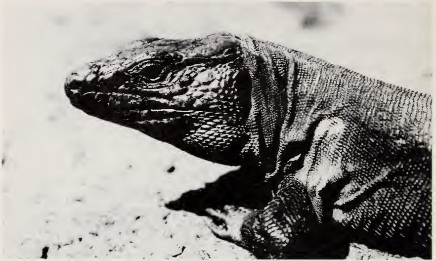
Fig. 1: Lagarto Gigante de El Hierro ( Gallotia aff. simonyi ), un reptil extremadamente amenazado de extinción. Su población actual (Agosto 1984) se estima en un centenar de individuos.

les Amenazados del Consejo de Europa (Honneger 1978); con igual categoría en el Red Data Book de la UICN (Groombridge 1982) y, últimamente, también aparece incluido en el Registro Federal de 29 de Febrero de 1984, del Fish & Wildlife Service, de los Estados Unidos, que incorpora también especies amenazadas en el extranjero, en virtud de la Endangered Species Act de 1973.