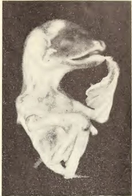
Abb. 1 und 2: Myotis myotis — Embryo, Austragezeit ca. 28 Tage.