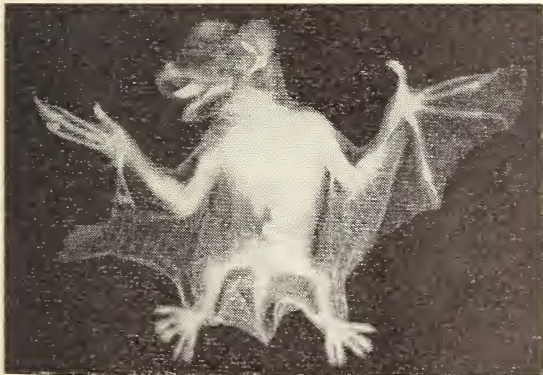
Abb. 3: Myotis myotis — Embryo, Austragezeit ca. 32 Tage.