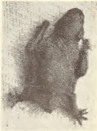
Abb. 4: Pipistrellus pipistrellus , 2 Tage alt.

Kolbow (1934), die als Zeit für die Entwicklung des Eies bis zur Nidation 14 Tage angeben, betragen die Austragezeiten für E 1 28 Tage, für E 2 32 Tage und für E 3 26 Tage. Bei allen drei Embryonen waren die Milchzähne noch nicht durchgebrochen, aber durch die dünne Schleim-