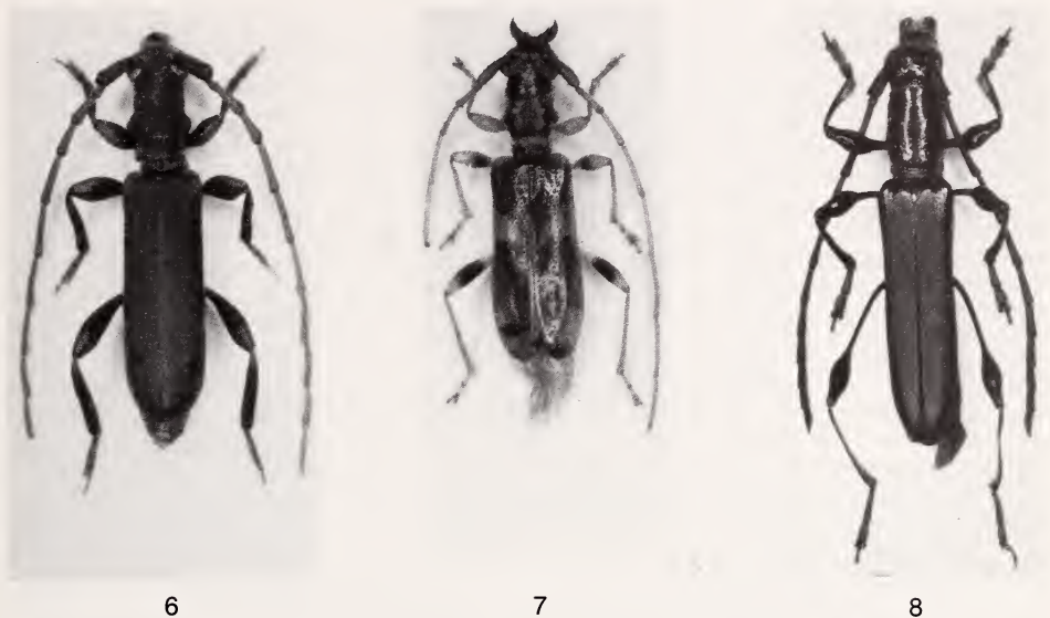
Abb. 6: Duffyoemida gracilis sp. n., ♂, Holotypus. — Abb. 7: Stenhomalus togoensis sp. n., ♀, Holotypus. — Abb. 8: Philomeces agouensis sp. n., ♂, Holotypus.