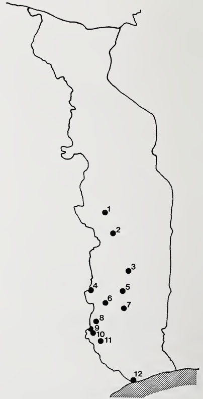
Abb. 1: Lage der Fundpunkte in Togo.

Der Fundort „Kolate, Kuma-Konda“ ist uns nicht bekannt, er bezieht sich jedenfalls auf die Umg. von Kpalimé.