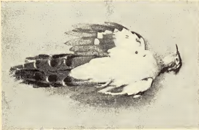
Abb. 5: Dromococcyx phasianellus ♂, frischtot. Alto Xingú, Mato Grosso, 23. 9. 1951.