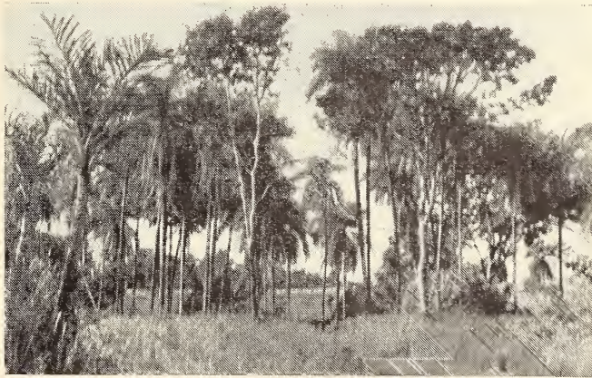
Abb. 2: Biotop von Tapera naevia im Quellgebiet des Rio Xingú, Mato Grosso. Natürlicher grasunterwachsener Palmenhain, im Mittelgrund das Lager Diauarum der Fundação Brasil Central.

Ogleich das „üih“ nicht an die Fortpflanzungsperiode gebunden ist (2 in der Kulmination des üih-Rufens erlegte Tapera hatten schwach entwickelte Gonaden), ist dieser Ruf merkwürdigerweise doch auch bis zu gewissem Grade jahreszeitlich bedingt. Das wurde mir 1949 am Xingú klar. Ich befand mich in unserem Lager Diauarum, welches in einem lichten Naturbestand von Macauba- und Inajà-Palmen ( Acrocomia