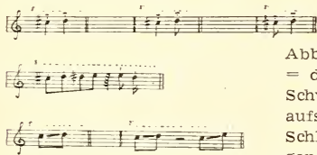
Abb. 1: Stimme von Tapera naevia . Oben: 1. Rufform = das gewöhnliche, 2-silbige „güp-gip“; Andeutung der Schwankung in der Tonlänge. Mitte: 2. Rufform = die aufsteigende Pfeiftonreihe mit herunterführendem Schlußton. Unten: 3. Rufform = der lang heraufgezogene üh-Pfiff, eventuell nach einer Pause wiederholt.

So oft die Stimme von Tapera schon in ornithologischen und folkloristischen Darstellungen behandelt worden ist, so unvollständig ist noch immer unsere Kenntnis von den Lautäußerungen dieses Kuckucks. Fast ausnahmslos führen die Beobachter einen einzigen Ruf des Saci an: denjenigen, der zu den lautmalenden Benennungen des Vogels geführt hat. Selbst dieser Hauptruf wird oft nicht richtig wiedergegeben. Er besteht aus 2 Tönen (Silben) im Abstand von einer kleinen Sekunde, der