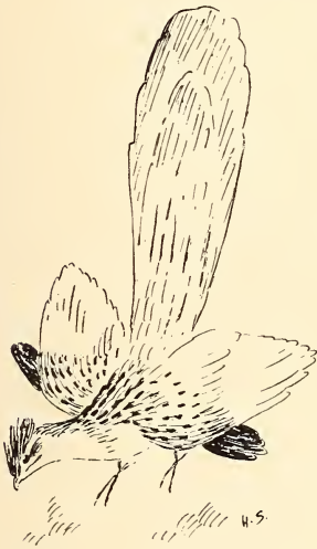
Abb. 3: Tapera naevia , am Boden umherhüpfend mit herausgestellter Alula.

Juriti-Taube ( Leptoptila sp.) wurde ich gelegentlich durch ein Rascheln im Fallaub auf den Kuckuck aufmerksam. Ohne Hast schreitet er einher, ab und an einen Widergang machend und etwas aufpickend. Mitunter wird er lebhafter und bewegt den rostroten Schopf auf und nieder. Dann zuckt es in seinen Flügeln, er hebt dieselben vom Körper ab und läßt die Alula vorschnellen. Da diese unverhältnismäßig groß und kohlschwarz gefärbt ist, macht das an sich einfache Manöver einen bizarren Eindruck. Als ich es sah wurde mir spontan klar, warum die Kolonisten Espirito Santos glauben, der Saci habe 3 Köpfe: die abgestellten dunklen Afterflügel des am Boden umherhüpfenden Vogels wirken wie 2 seitlich angebrachte Neben-Köpfe (s. Abb. 3).