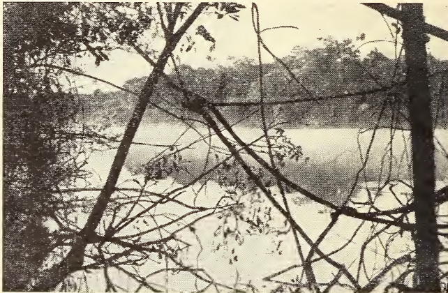
Abb. 7: Biotop von Dromococcyx phasianellus in Zentralbrasilien. Uferwald an einem Xingú-Altwasser im Morgennebel.

Wenden wir uns nun weiteren Zügen der Lebensweise von Dromococcyx zu, nämlich seinen biotopischen Ansprüchen und seiner Ernährung. Beide Dromococcyx sind Vögel schattiger Dickichte, wie sie sich in Zentralbrasilien an Waldrändern und im Niederwald der Überschwemmungszone der Flüsse finden. Der Überschwemmungswald (s. Abb. 7) zeichnet sich in