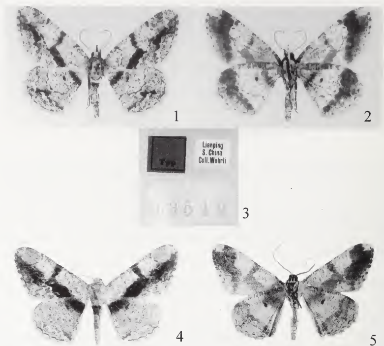
Figs 1–3: Psilalcis diorthogonia Wehrli – Lectotype. 1: recto, 2: verso, 3: étiquettes. – Figs 4–5: Psilalcis stueningi n. sp. – Holotype. 4: recto, 5: verso.

Lectotype, ici désigné, pour des raisons de stabilité nomenclaturale: mâle, «Lienping, S. China, Coll. Wehrli» (étiquette imprimée) – «Typ» (rouge, étiquette imprimée) – «03519» (numéro du journal de H. Höne, tampon). Coll. ZFMK.