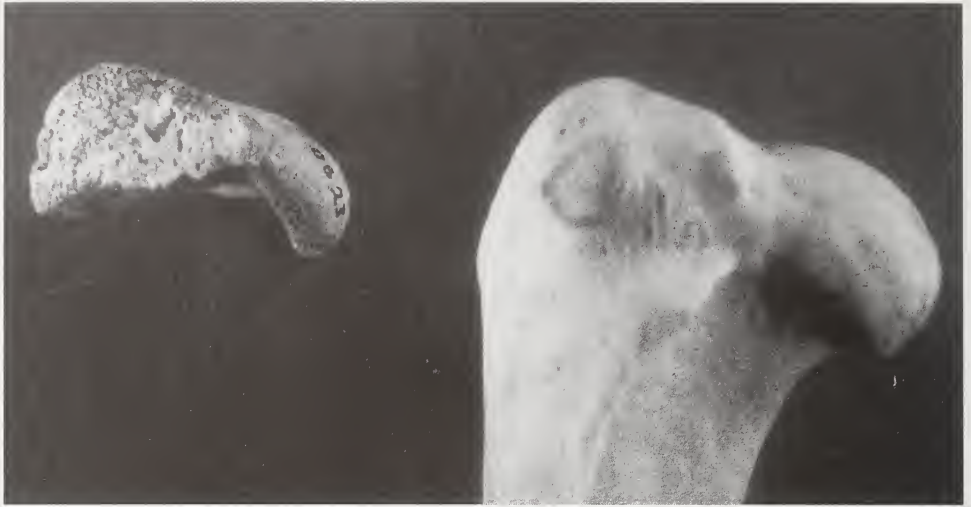
Abb. 2: Nicht verwachsene Epiphyse eines linken Humerus des Hundes von Bonn-Oberkassel (im Vergleich zu einem rezenten Schäferhund-Mischling).

Die Inventarnummer D 1001 a (RLMB D001001, 01) beschreibt den Schaft eines rechten Oberarmknochens (Abb. 3). Den einzig möglichen Messwert (nach von den Driesch 1976) liefert die kleinste Breite der Diaphyse SD (Tabelle 7), welche nochmals zeigt, dass der Oberkasseler Hund deutlich kleiner als der rezente Mischling (wenn auch größer als ein präborealer Hund von Bedburg-Königshoven) war. In Analogie zur linken proximalen Epiphyse RLMB D001001, 14 (OB 23) war der Knochen wohl nicht verwachsen und ist folglich einem jüngeren Tier zuzuordnen.