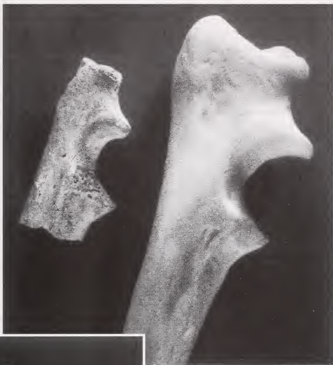
Abb. 5: Rechte Ulna des Hundes von Bonn-Oberkassel.