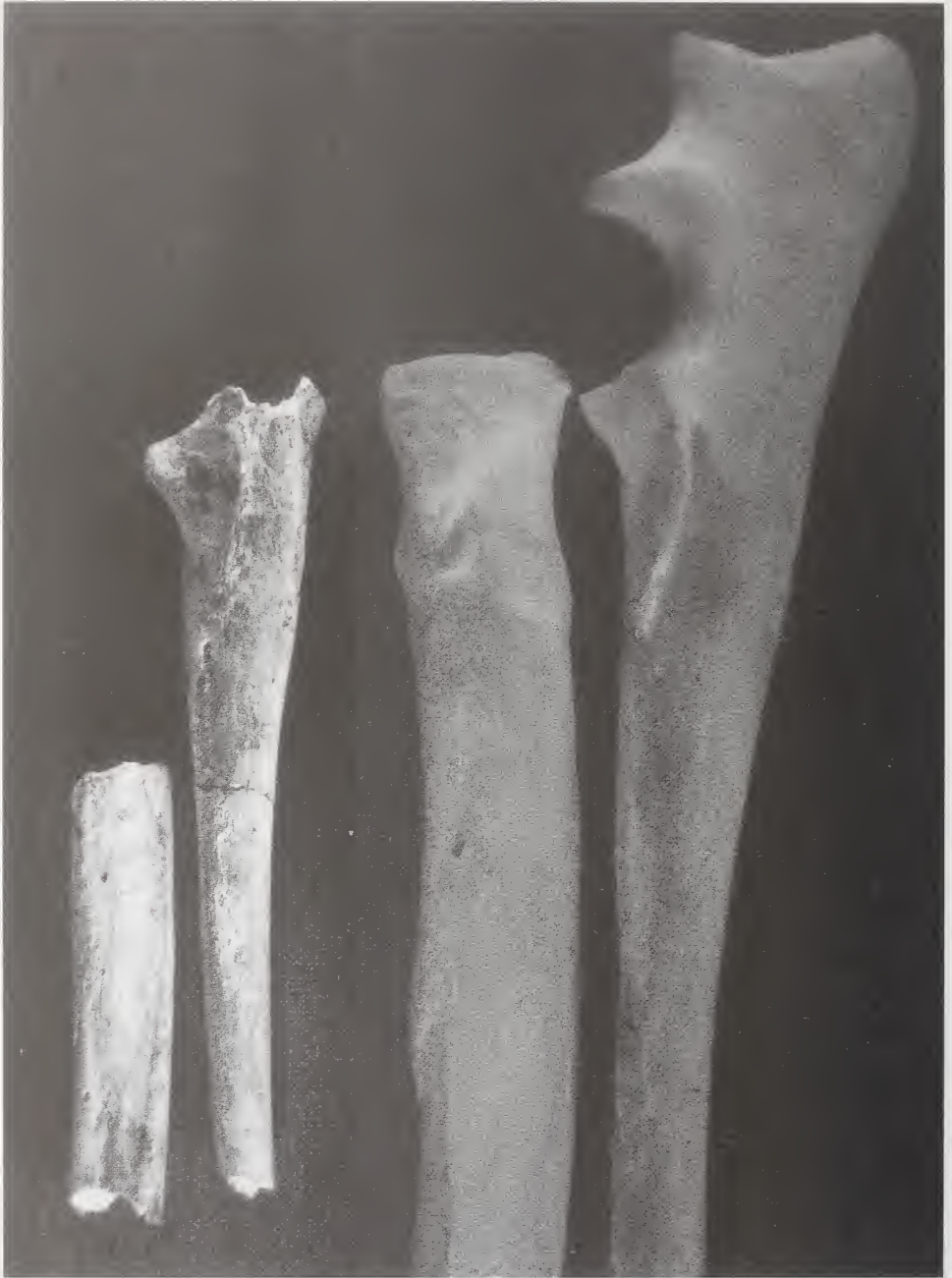
Abb. 4: Zusammengehörende Radius und Ulna der linken Vorderextremität des Hundes von Bonn-Oberkassel.