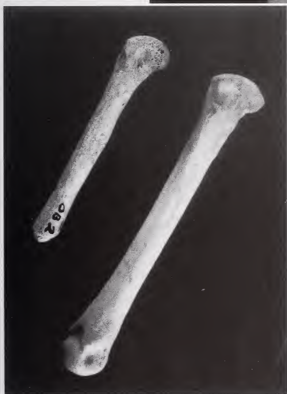
Abb. 6: Linker Metacarpus IV des Hundes von Bonn-Oberkassel.