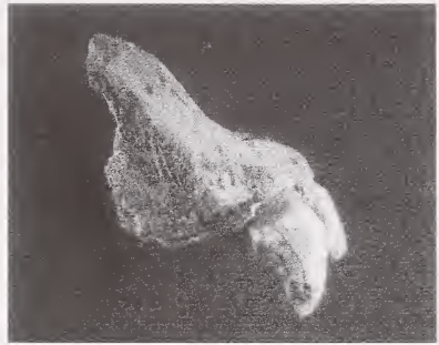
Abb. 1: Intermaxillare (rechts) des Hundes ( Canis lupus f. familiaris ) von Bonn-Oberkassel.

Insgesamt sechs Einzelzähne werden unter der Inventarnummer RLMB D001001, 01 zusammengefasst. Wahrscheinlich sind sie, wie die Ober- und Unterkieferfragmente, immer im RLM Bonn aufbewahrt worden, wohl ursprünglich unter der Inventarnummer D1001a. Die