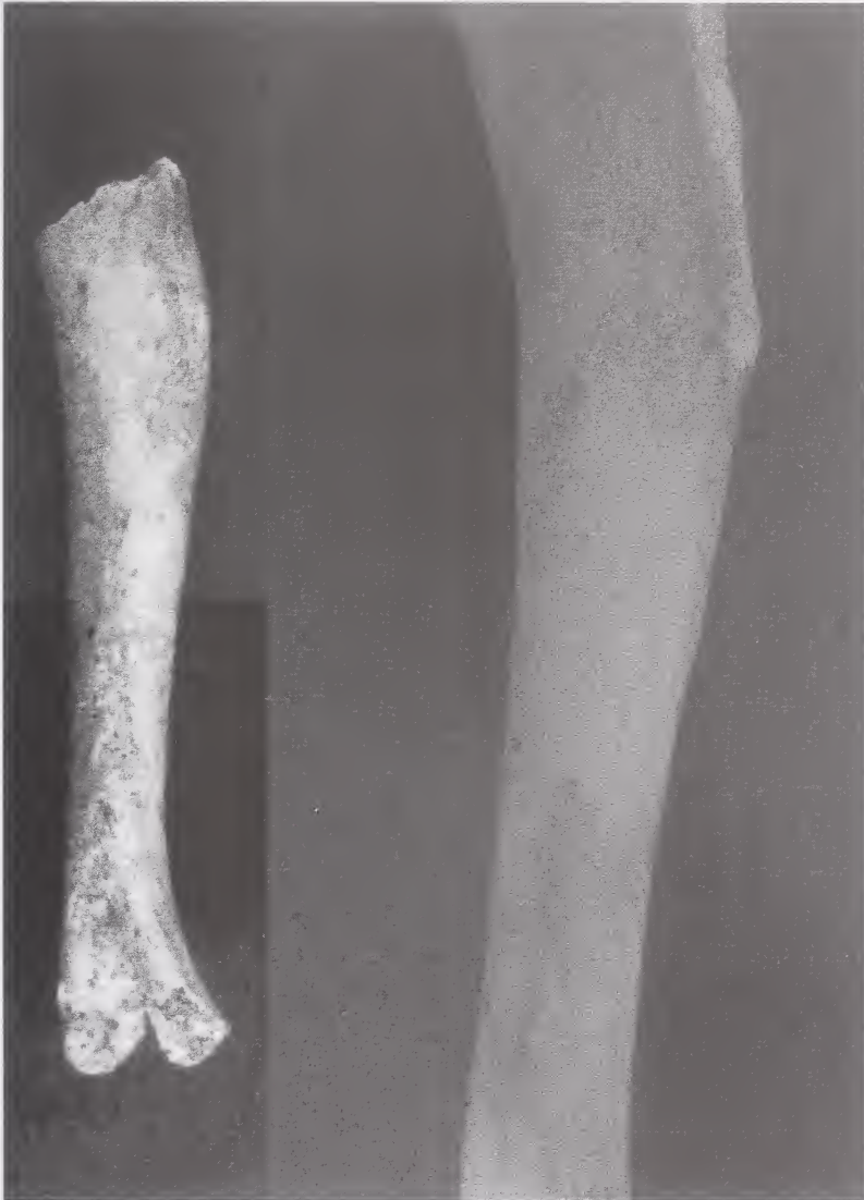
Abb. 3: Schaftfragment eines rechten Humerus des Hundes von Bonn-Oberkassel.

Eine Bärenart ist in Bonn-Oberkassel durch drei Funde vertreten.