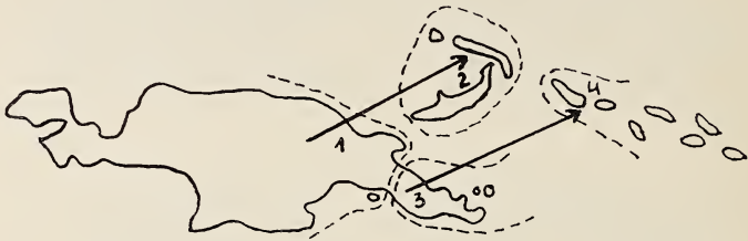
Abb. 1. Verbreitungskarte des Rassenkreises Scapanes australis Boisd. (die Pfeile bezeichnen die mutmaßlichen Ausbreitungslinien der beiden Äste).

chagrinierten Flügeldecken und die seitlich stärker zusammengedrückten Thorakalhörner (s. Abb. 6 u. 7) gemein, dagegen ist die Körperform breiter und kürzer, die Chagriniierung der Flügeldecken bei S. a. brevicornis Sternb. und S. a. salomonensis Sternb. stark. Bei beiden Ästen wird nach Osten die Körperform etwas breiter und kürzer und die Skulptur der Flügeldecken gröber.