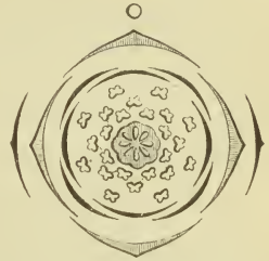
Diagramm von Illipe latifolia (Roxb.) Engl.

Auch das Androeum von Omphalocarpum ist als ein tricyklisches aufzufassen; an den Blüten von O. Radlkoferi Baill. habe ich mich davon überzeugt, dass die Staubblätter in einigen Kreisen stehen und kein Zwang vorliegt, Spaltungen von Staubblattanlagen anzunehmen. Nach meiner Auffassung ist die Anordnung der Staubblätter und Carpelle bei Omphalocarpum folgende: