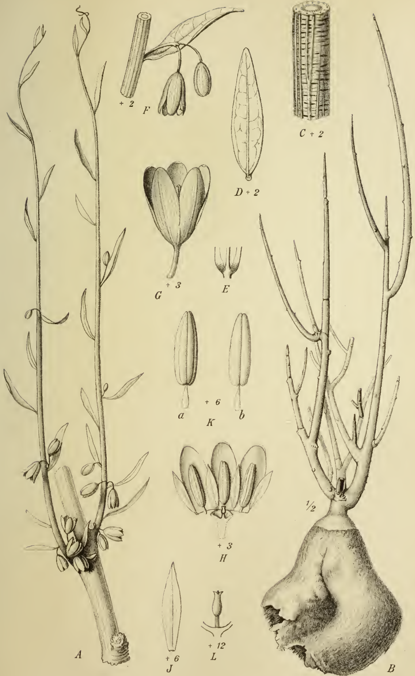
Echinothamnus Pechueli Engl.