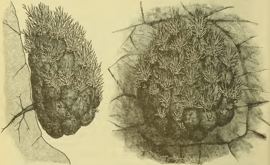
Echinothammus Pechuelii Engl. \frac{1}{20} natürl. Gr. Ganzer Stamm, links von der Seite mit seiner in den Felsritz eindringenden Pfahlwurzel, rechts von vorn gesehen.

zeigen, von der Epidermis entblößt, die für die Adenieae charakteristischen Stereombündel, zwischen diesen das vertrocknete Grundgewebe; die secundären Zweige haben 5—45 cm Länge, 2—3 mm Dicke. Die Blätter sind durch 4,5—4 cm lange Internodien getrennt, sie werden nur 1,5 cm lang, 3 mm breit und besitzen am Grunde 2 Honiggruben von 1 mm Durchmesser. Am Grunde der Sprosse stehen häufig in den Achseln dicht gedrängter kleiner Blätter zahlreiche Blütenzweige. Die kleinen Blütenzweige sind kaum 4 mm lang, mit nur 0,5 mm langen Vorblättern; sie sind 3blütig, 2blütig und 1blütig, mit mehr oder weniger genäherten Vorblättern. Das Receptaculum ist unterwärts stiel-förmig, bis zu 3 mm, der becherförmige Teil wird kaum 2 mm hoch, mit 2,5—3 mm Durchmesser. Die Kelchblätter werden 3 mm lang und 2 mm breit, die Blumenblätter dagegen kaum 2 mm lang und nicht einmal 4 mm breit. Die Antheren haben die gleiche