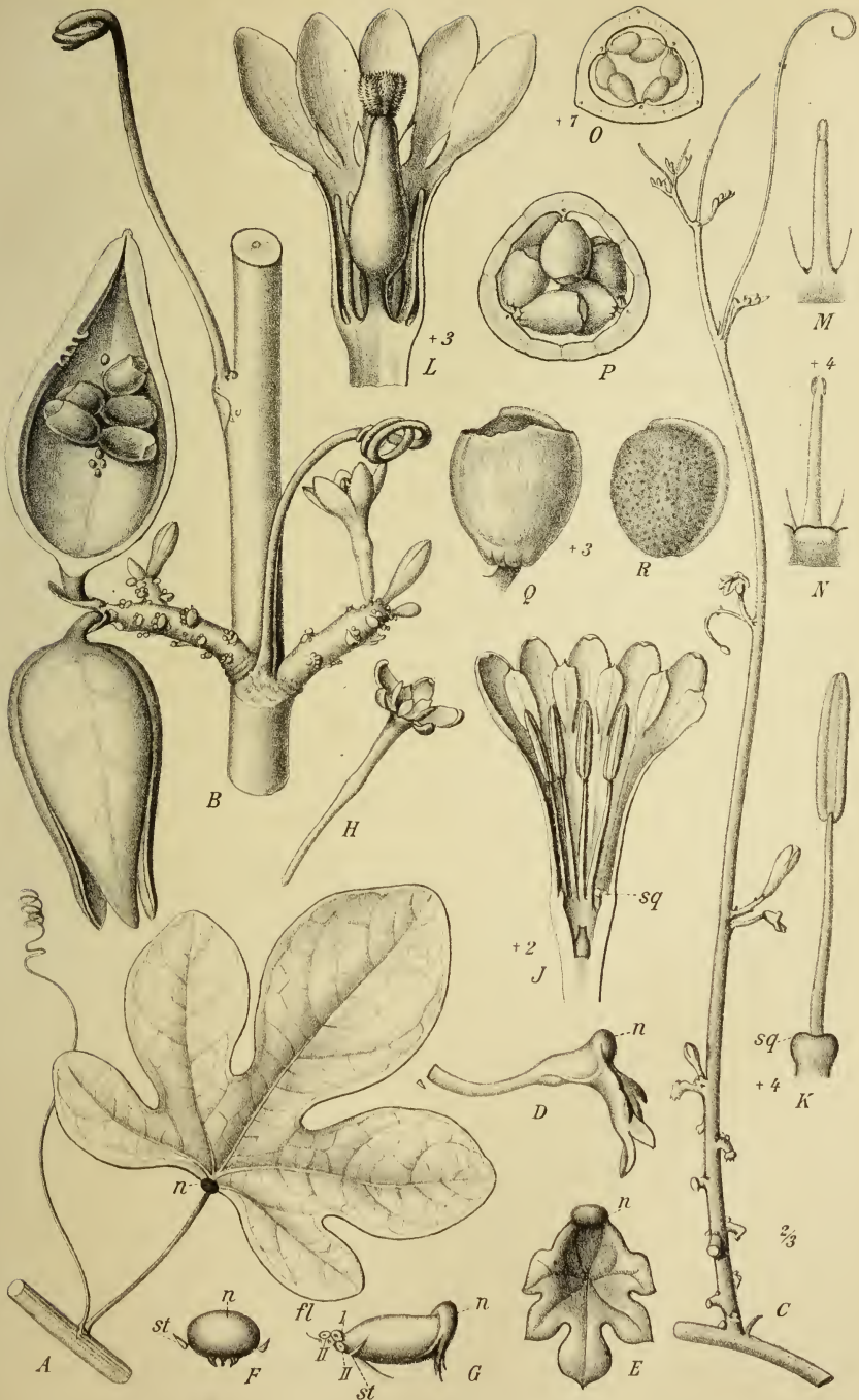
Adenia venenata Forsk.