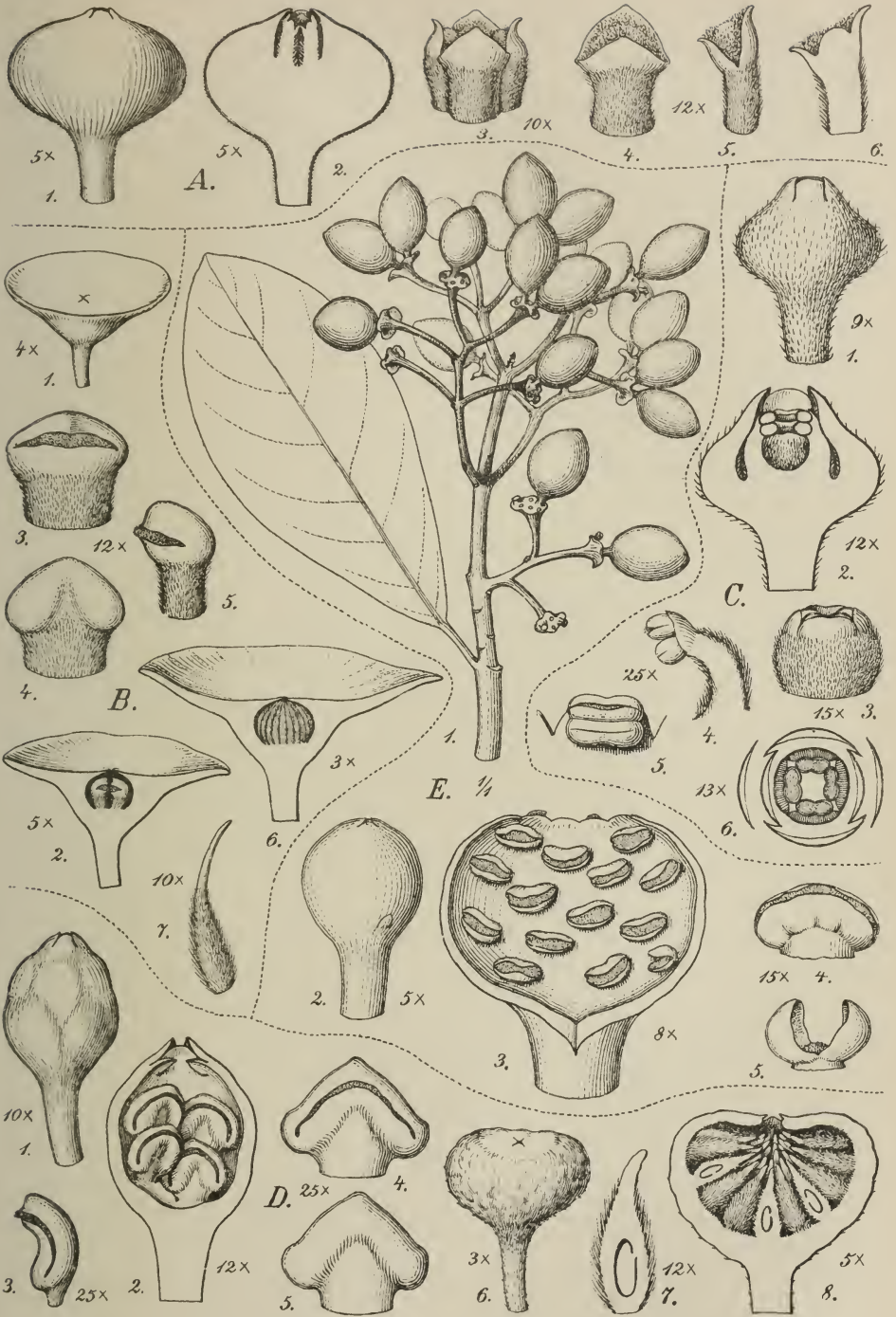
A. Stegantheris thyrsoiflora Perk., B. Anthobembix hospitans (Becc.) Perk., C. Tetrasynandra laxiflora (Benth.) Perk., D. Wilkiea macrophylla (A. Cunn.) A. DC., W. Wardellii (F. v. M.) Perk.