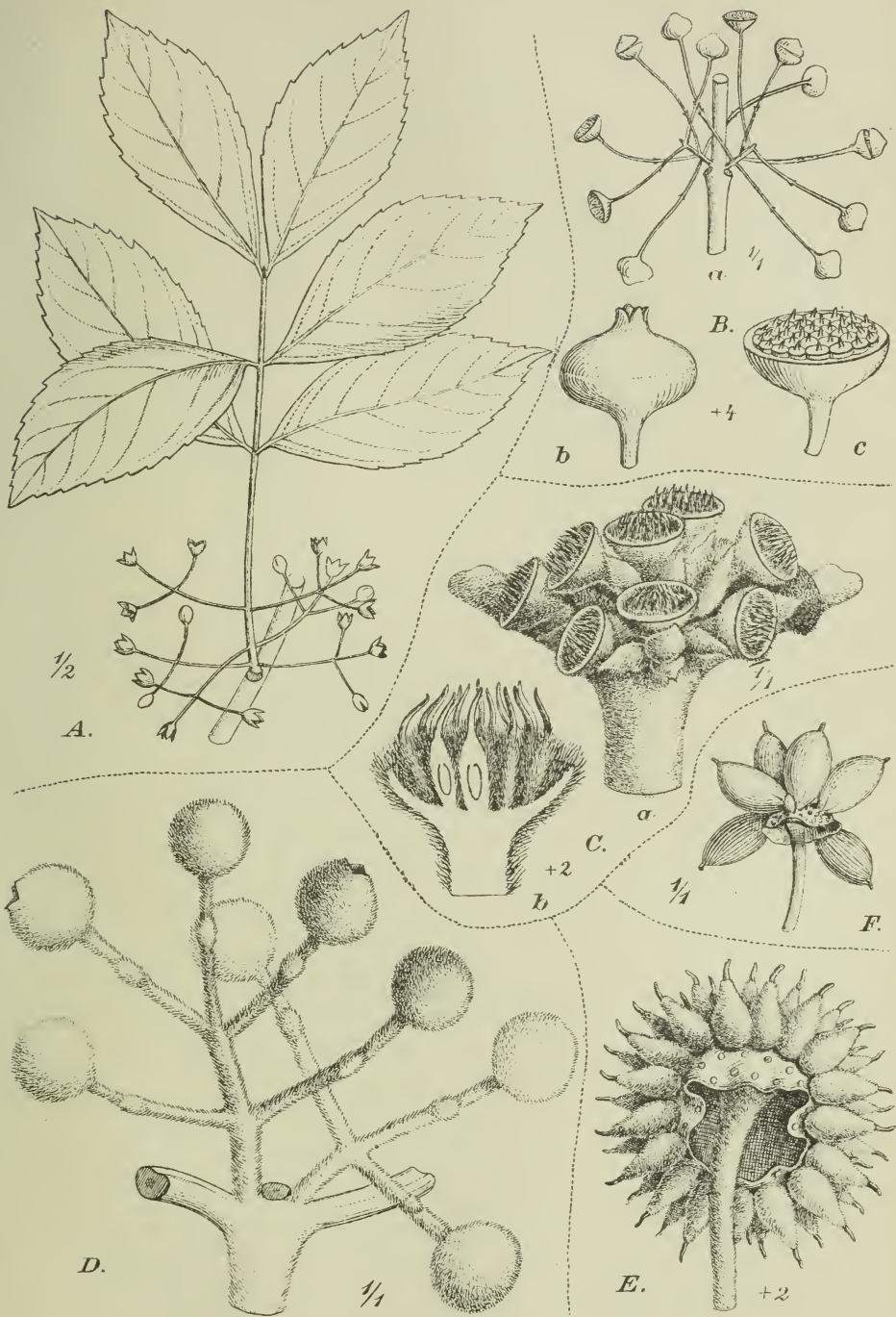
A. Mollinedia calondonta Perk., B. a—c. M. fasciculata Perk., C. a—b. M. lamprophylla Perk., D. M. Glaziovii Perk., E. M. Selloi (Spreng.) A. D. C., F. M. Schottiana (Spreng.) Perk.