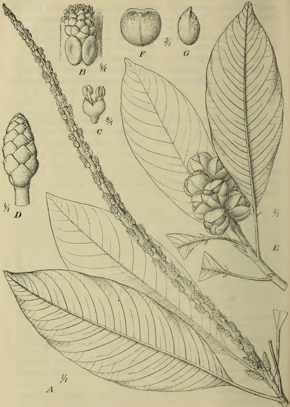
Fig. 2. A, B, C, D Sapium eglandulosum Ule. A Blühender Zweig. B ♂ Blütenhäufchen. C ♂ Bl. D ♀ Blütenähre. — E, F, G Sapium taburu Ule. E Fruchtender Zweig. F Samen von der Seite. G Samen von der Kante aus.