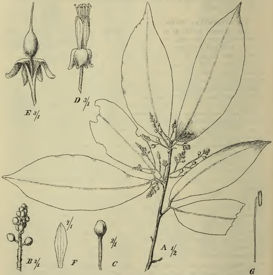
Fig. 3. Cynometra Engleri Harms. A Habitus. B Stück des Blütenstandes. C Knospe. D Blüte. E Blüte, nach Entfernung der Blumenblätter und Staubblätter, mit aufgeschlitztem Receptaculum. F Blumenblatt. G Staubblatt.

saepius parum distincto acuto vel obtuso), utrinque glabris et fere concoloribus, sed subtus pallidioribus, nervis subtus parum prominulis; paniculis axillaribus folio pluries vel multoties brevioribus, e racemis plurifloris gracilibus, tenuibus compositis, pedicellis gracilibus longiusculis, bracteis minimis, mox deciduis, subsemiorbicularibus, squamiformibus, bracteolis 2, illis simillimis, minimis, late ovatis, paulo supra basin pedicelli insertis, inter sese paullulo remotis, mox deciduis; receptaculo breviter infundibuliformi,