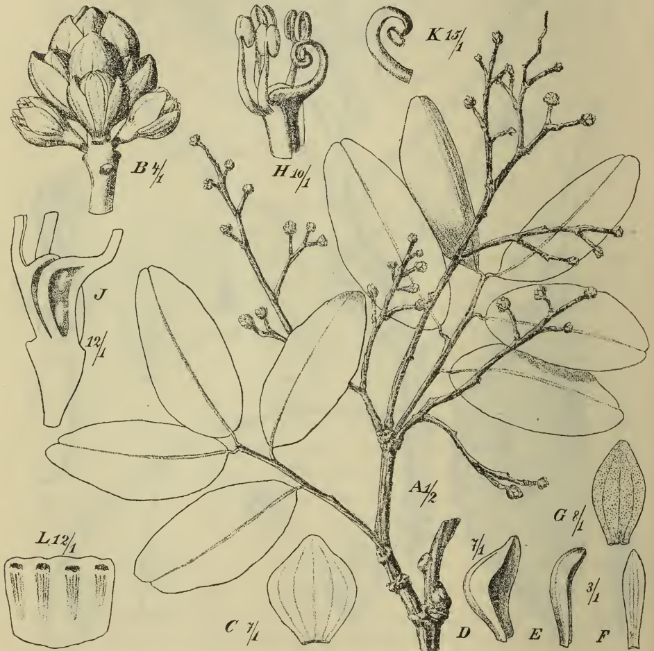
Fig. 2. Stemonocoleus micranthus Harms. A Habitus. B Stück des Blütenstandes. C Tragblatt von innen, D von der Seite. E Vorblatt von der Seite, F von innen. G Kelchblatt. H Diskus mit Staubblättern und Fruchtknoten, dieser bei J im Längsschnitt. K Oberster Teil des Griffels. L Diskus von außen, mit den Ansatzstellen der Staubblätter.

Receptaculum breviter infundibuliforme, basi incrassata, disco stamifero unilaterali e margine receptaculi longius exserto, vaginiformi, uno latere aperto, margine summo leviter involuto. Sepala 4, in alabastro imbricata, paullo inter se inaequalia, ovalia usque ovali-oblonga, obtusa,