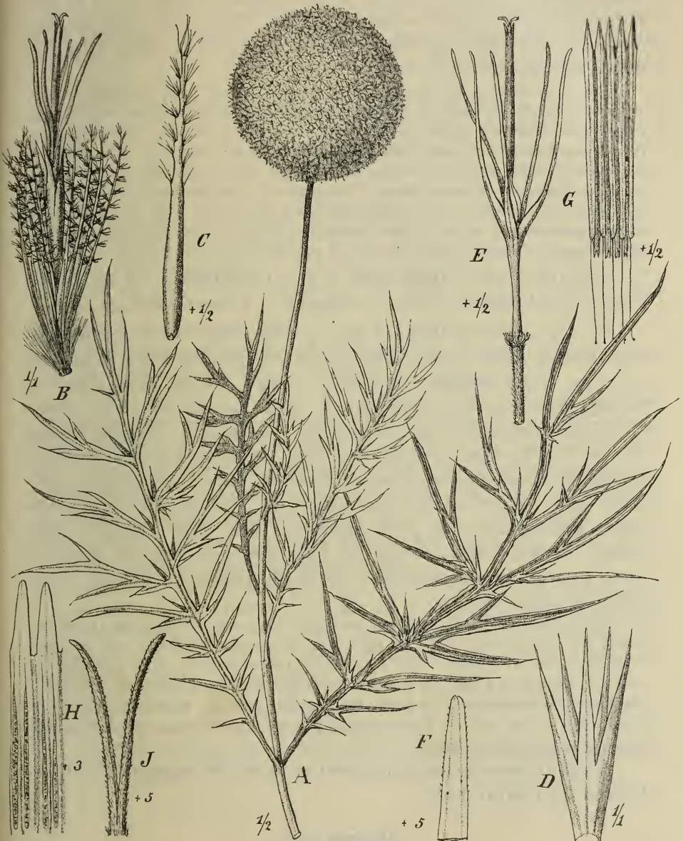
Fig. 5. Echinops Ellenbeckii O. Hoffm. A Ende des Stengels mit Blütenstand; B einzelnes Köpfchen mit den äußeren und inneren Involukrallättern und der Blüte; C äußeres Involukrallblatt; D die inneren Involukrallblätter verwachsen; E Blüte; F Ende eines Blumenkronabschnittes; G Androeceum; H 2 Antheren vergr.; J Griffelspitze. — Original.

bus iterum pinnatipartitis; segmentis omnibus anguste linearibus in apicem angustissimum pungentem attenuatis, margine revolutis; glomerulo terminali magno, capitulis propriis numerosis; penicilli setis extimis brevibus