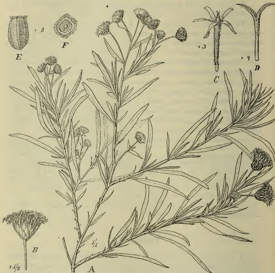
Fig. 1. Herderia somalensis O. Hoffm. A Zweig; B Köpfchen; C Blüte; D Griffel; E Achänium von der Seite; F dasselbe von oben. — Original.

\frac{1}{2} m hoher Strauch; Blätter bis 5 cm lang und 3,5 mm breit. Blütenstiele bis 2 cm lang. Köpfchen 7 mm hoch, voll aufgeblüht 13 mm im Durchmesser; Hülle 3 mm hoch, 7 mm im Durchmesser. Früchte 3 mm lang, kaum über 4 mm dick; Pappusborsten äußerst winzig, doch von den Haaren der Frucht deutlich verschieden. — Die Arten der Gattung Herderia besitzen sonst einen aus Schüppchen bestehenden Pappus, doch sind diese Schüppchen schon bei H. stellulifera Benth. oft sehr schmal. Jedenfalls paßt die Pflanze durch ihren Pappus besser zu Herderia als zu Ethulia , welche sonst in Frage kommen könnte. Auch zur Begründung einer neuen Gattung scheint die Verschiedenheit von Herderia nicht groß genug zu sein.