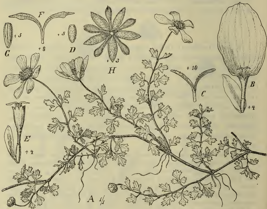
Fig. 3. Coreopsis pulchella O. Hoffm. A Ganze Pflanze; B Spreuschuppe und Randblüte, C Griffel; D Achänium der Randblüte; E Spreuschuppe (Tragblatt) und Scheibenblüte; F Griffel derselben; G Achänium derselben; H Involukrum. — Original.

C. pulchella O. Hoffm. n. sp. (Fig. 3); herba prostrata ramosa, ramis gracilibus parce pilosis foliosis; foliis parvis petiolatis, petiolo basi dilatato parce piloso, lamina subglabra tripartita segmentis iterum 2—5-fidis, laciniis acutis vel apiculatis; capitulis mediocribus ramos terminantibus pedunculatis; involucri squamis aequilongis, exterioribus 5—7 carnosulis spatulatis glabris, interioribus late ellipticis membranaceis puberulis; floribus radii 4 ♀ involucrium duplo superantibus, disci paulo exsertis; achaenio exalato margine parce ciliato anguste obovoideo obtuso; pappo nullo vel ad dentes 2 breves reducto.