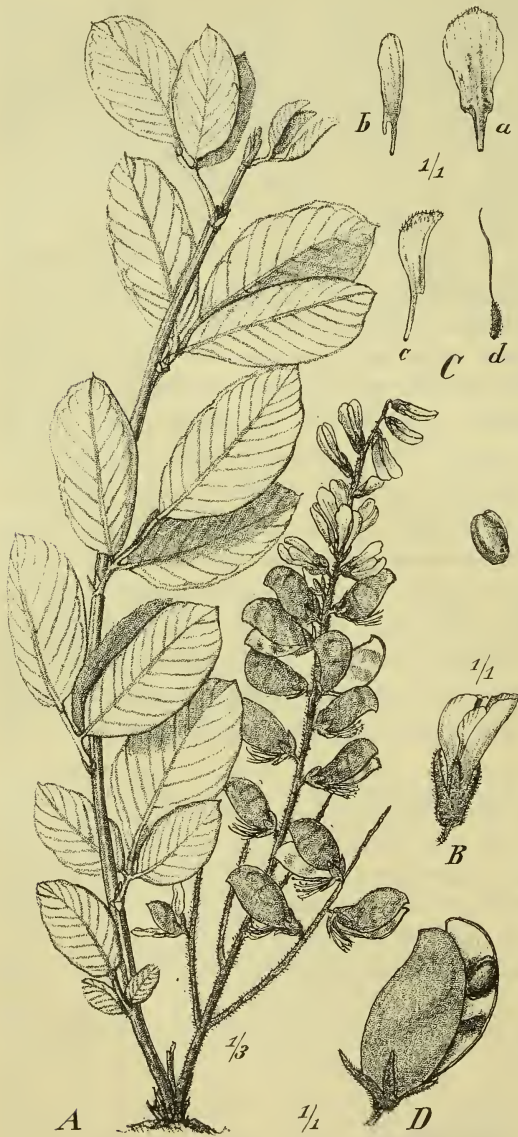
Fig. 4. Eriosema Englerianum Harms. A Habitus. B Blüte. C Blütenteile, a Fahne, b Flügel, c Schiffchen, d Pistill. D Hülse. E Same.

leviter emarginulatis, apice rotundatis vel obtusis vel rarius subacutis vel acutiusculis, saepe mucronulatis, margine interdum leviter undulatis, supra