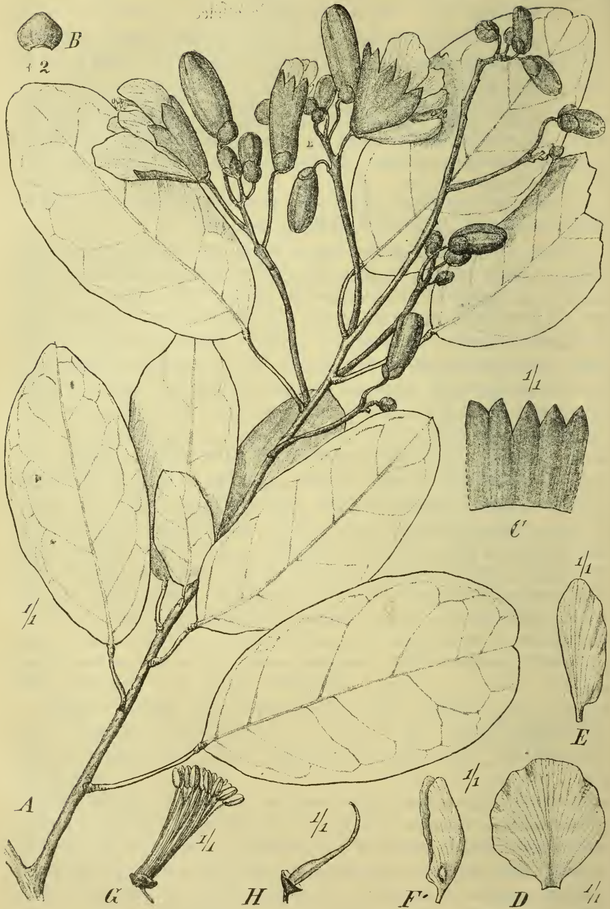
Fig. 3. Baphia macrocalyx Harms. A Habitus. B Vorblatt, von außen. C Kelch, ausgebreitet. D Fahne. E Flügel. F Schiffchen. G Staubblätter. H Pistill.