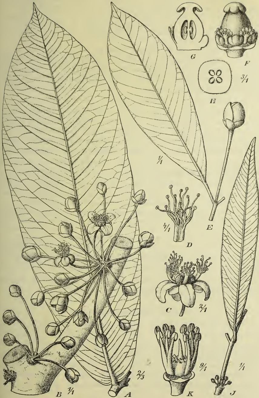
Fig. 4. A—D Garcinia Staudtii Engl. A Blatt, B Blütenzweig, C ♂ Blüte, D Bündel der Staubblätter. — E—H G. Dinklagei Engl. E Zweig mit Blüte, F ♀ Blüte, G Pistill im Längsschnitt, H dasselbe im Querschnitt. — J, K G. edcensis Engl. J Blühender Zweig, K ♂ Blüte.