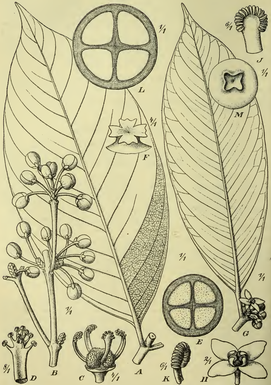
Fig. 2. A—F Garcinia densivenia Engl. A Blatt, B Blütenzweig, C ♂ Blüte, D Phalange eines Staubblattes, E Querschnitt einer jungen Frucht, F Narbe. — G—M G. mimfensis Engl. G Blühender Zweig, H ♂ Blüte, J, K Staubblattphalange, L Querschnitt der Frucht.