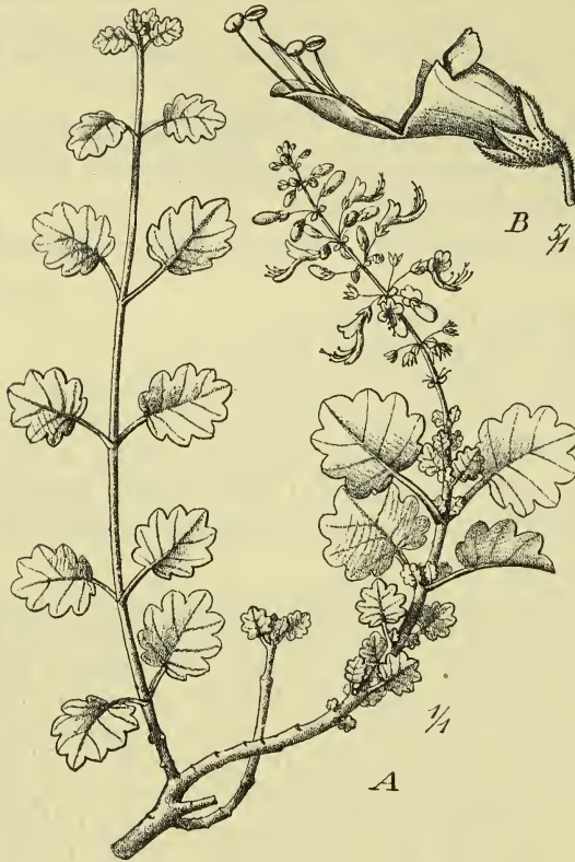
Fig. 4. Plectranthus Erlangeri Gürke. A Blühender Zweig; B Blüte.

Blätter sind fast kreisrund, manchmal breiter als lang, bis 40 mm lang und bis 42 mm breit, am Grunde stumpf oder fast herzförmig, am Rande sehr grob gekerbt, an jeder Seite nur 3—6 Kerbzähne, von Konsistenz dickkrautig, beiderseits von grauen Haaren dichtflaumig; die Blattstiele sind sehr dünn und bis 5 mm lang. Der terminale