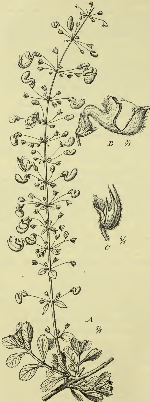
Fig. 2. Coleus gracilis Gürke. A Blühender Zweig, B Blüte, C Fruchtkelch.

West-Usambara: im immergrünen Regenwald, Schagajuwald bei Mlalo, 1400—1600 m ü. M. (ENGLER n. 4394. — Fruchtend im Oktober 1902).