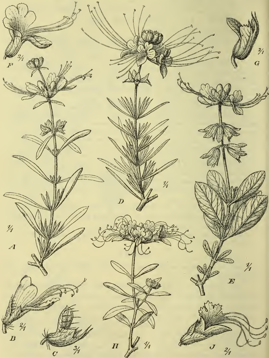
Fig. 3. Ocimum Stirbeyi Volk. et Schweinf. A Blühender Zweig; B Blüte; C Fruchtkelch. — O. formosum Gürke. D Blühender Zweig. — O. Ellenbeckii Gürke. E Blühender Zweig; F Blüte; G Fruchtkelch. — O. pumilum Gürke. H Blühender Zweig; J Blüte.

breit, am Grunde sehr allmählich in den ganz kurzen Blattstiel verschmälert, ganzrandig, spitz, mit wenigen kurzen Haaren besetzt oder auch ganz kahl, und außerdem zahlreiche Drüsen tragend, welche im getrockneten Zustande tief eingesenkt und schwarz