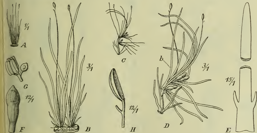
Fig. 4. Ledermanniella linearifolia Engl. A, B Unverzweigte Sprosse, C, D verzweigter Sproß, E das Blatt b dieses Sprosses vergr., F Spathella geschlossen, G sehr junge Blüte, H stehen bleibende 5-nervige Klappe der Frucht.

L. linearifolia Engl. n. sp.; turiones simplices vel parce ramosi. Folia angustissime linearia, ea ad basin ramulorum supra basin breviter bidentata. Spathella clausa claviformis breviter apiculata. Pedicellus valde elongatus folia aequans. Tepala? Staminum filamenta quam antherae plus duplo breviora. Pistillum breviter stipitatum. Capsula inaequaliter bivalvis, valva persistente late oblonga, naviculiformi, 5-nervia. — Fig. 4.