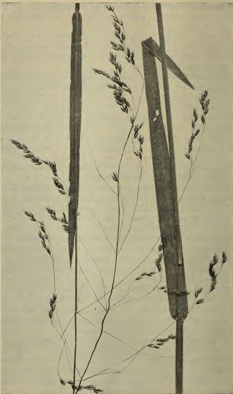
Fig. 1. Poa remota Forskell (Nat. Größe).