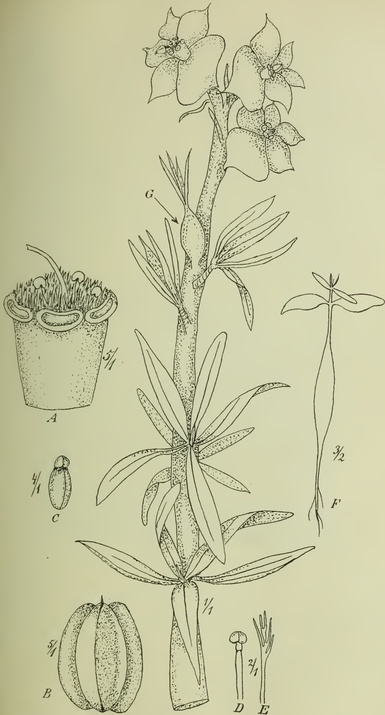
Fig. 5. Euphorbia lactiflua Phil. Die Hauptfigur stellt einen blühenden Zweig dar; bei G eine der sehr häufigen, wohl von einer Hymenoptere herrührenden Gallen. A Blütenbecher, B Frucht, C Samen, D Staubblatt, E eine der gezähnten, zwischen den Stb. stehenden Schuppen, F Keimpflanze.