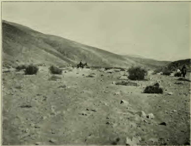
Fig. 4. Vegetation von Eremocharis fruticosa Phil. zwischen Guamanga und Las Animas.