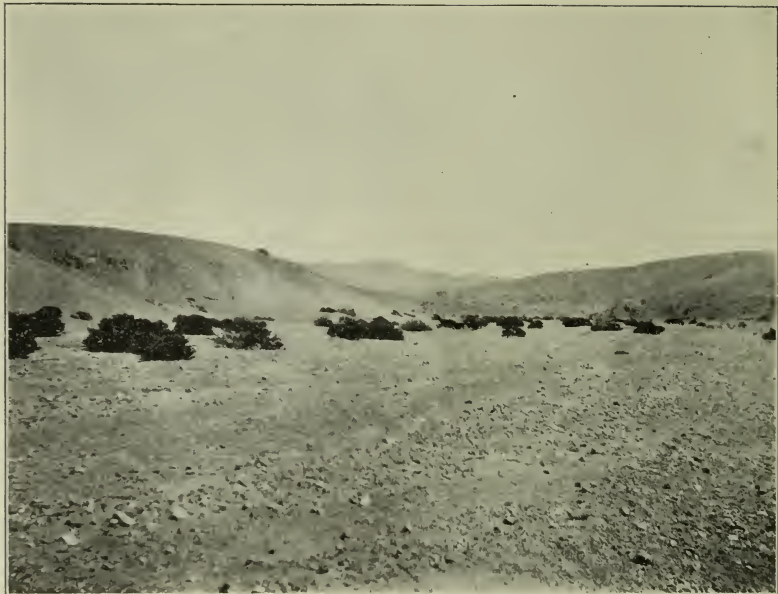
Fig. 3. Vegetation von Gypothamnium pinifolium Phil. zwischen Taltal und Las Breas.