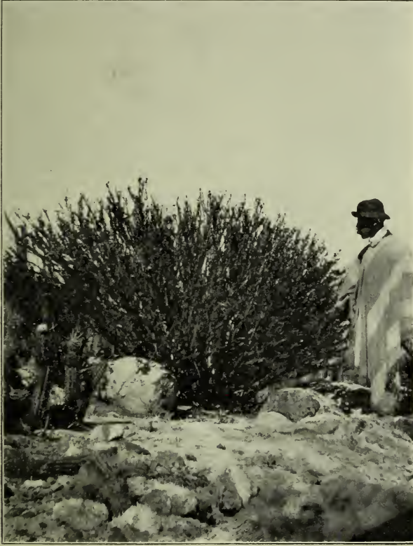
Fig. 7. Ein Euphorbia -Strauch bei Chañaral.