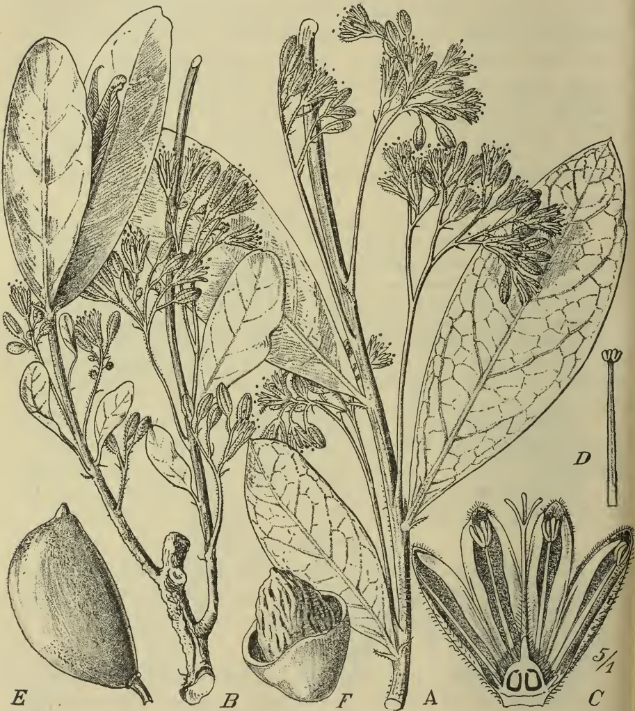
Fig. 2. D. venenatum Engl. et Gilg. A Zweigstück aus der Mitte eines 4 dm langen, grundständigen Astes; B unterer Teil der Pflanze mit jungen Sprossen; C Blüte im Längsschnitt; D Staubblatt; E Frucht; F dieselbe geöffnet.

lamina subchartacea glaberrima pallide viridis, oblonga vel obovato-oblonga, basin versus sensim angustata, apice acuta vel acutiuscula, 5—8 cm longa, 2,5—3,3 cm lata, nervis lateralibus 1 utrinque circ. 6—9 arcuatim ascendentibus cum venis numerosissimis reticulatis utrinque manifeste prominentibus. Pedunculi inferne 5—10 mm cauli adnati cum inflorescentia cymosa bis vel ter divisa 7—multiflora laxe pilosa folia aequantes; pedicelli