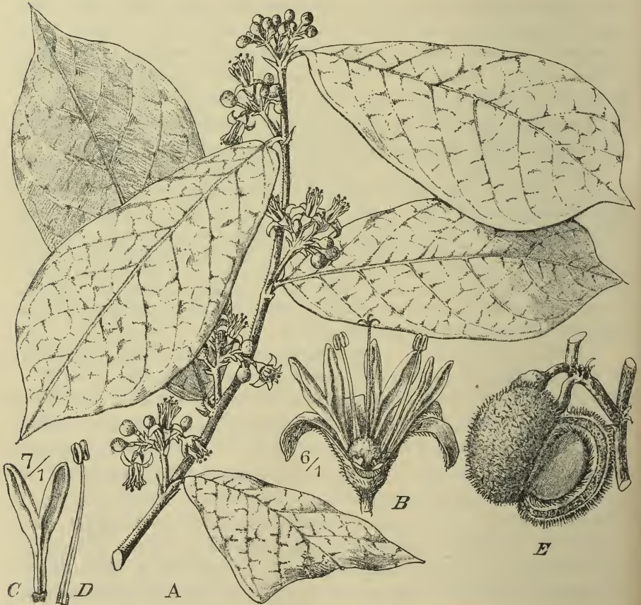
Fig. 1. Dichapetalum Bussei Engl. A Blühender Zweig; B Blüte nach Entfernung zweier Blumenblätter; C Blumenblatt mit Schüppchen; D Staubblatt; E Frucht, mit Längsschnitt eines Faches. — Original.

D. Bussei Engl. n. sp.; frutex parvus ramulis subteretibus validius-