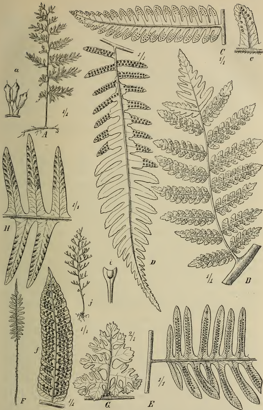
Fig. 1. A Trichomanes Hieronymi Brause, a Fertiler Fiederabschnitt. — B Cyathea novo-guineensis Brause, viertletzte Basalfieder I. — C Alsophila wangiensis Brause, Fieder II, c fertiger Fiederabschnitt. — D A. Schlechteri Brause, Fieder I nahe dem Blattscheitel. — E Dryopteris Schlechteri Brause, Basalstück einer Fieder I. — F D. conferta Brause, f Fieder I. — G Humata Schlechteri Brause, steriles Blatt. — H Davallia Engleriana Brause, Mittelstück eines Blattes. — J Lindsaya Schlechteri Brause, i fertiger Fiederabschnitt.