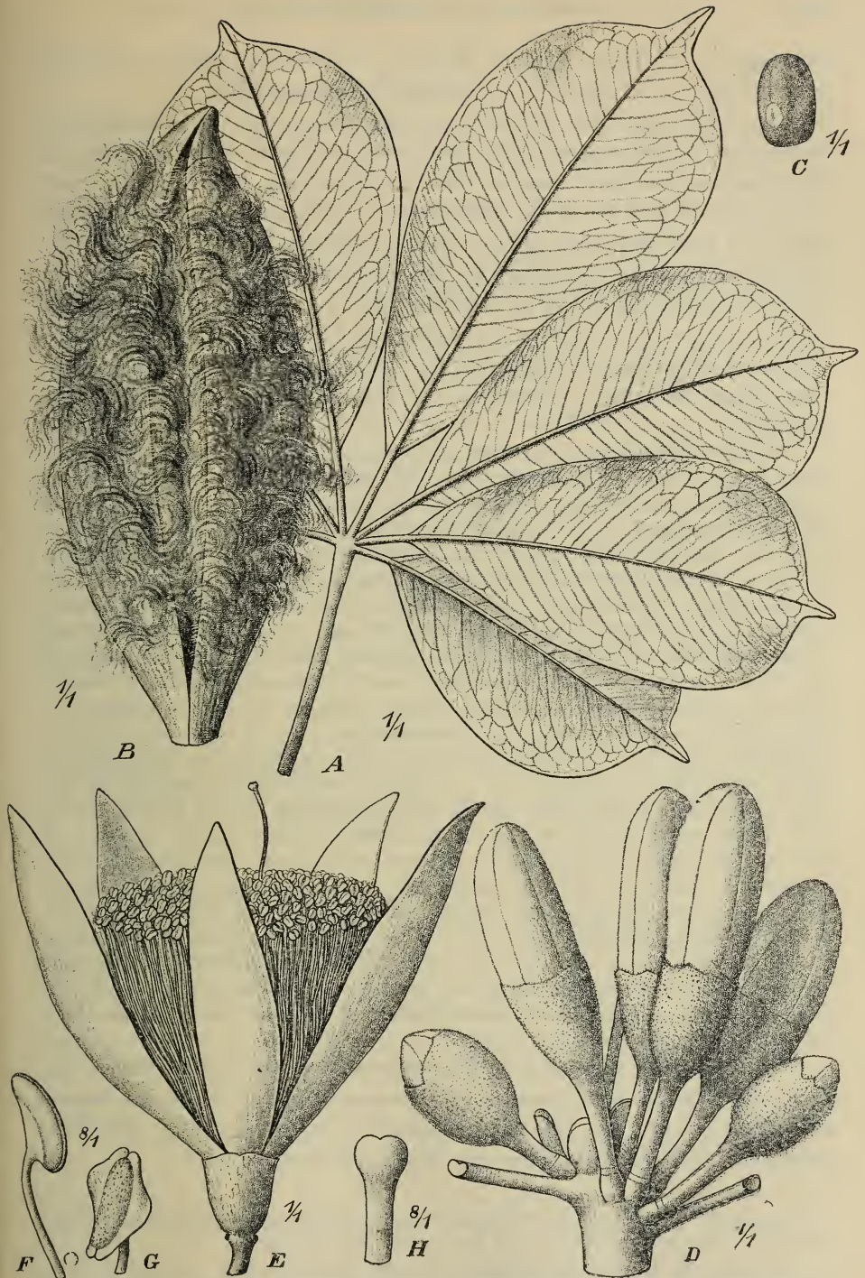
Fig. 3. Bombax rhodognaphalon K. Schum. A Blatt in natürl. Größe, B aufspringende Frucht, C Samen, D Blütenbüschel, E einzelne Blüte, F Anthere von der Seite gesehen, G dieselbe von vorn, H Narbe. — A—C nach SCHUMANN, D—H Original.