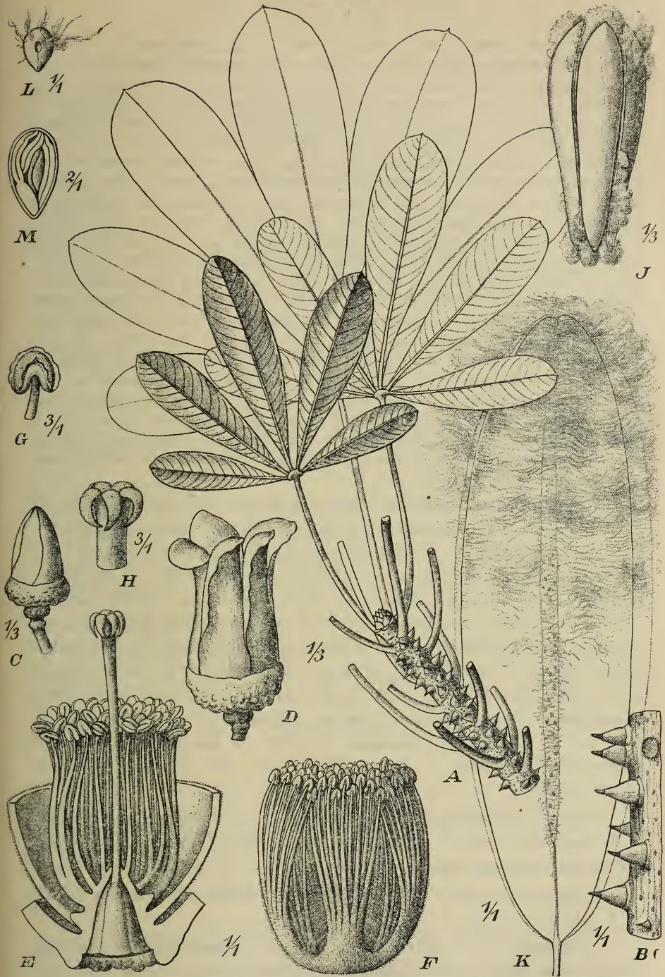
Fig. 1. Bombaz flammeum Ulbrich n. sp. A Beblätterter Zweig, B Rindenstück mit den Stacheln, C Blütenknospe, D Blüte, E Blüte im Längsschnitt, F Staminaltubus mit den Bündeln der Filamente, G Anthere, H Narbe, J Frucht aufspringend, K Mittelsäule der Frucht mit abgefallenen Samen, L Samen, M Samen im Längsschnitt. — Original.