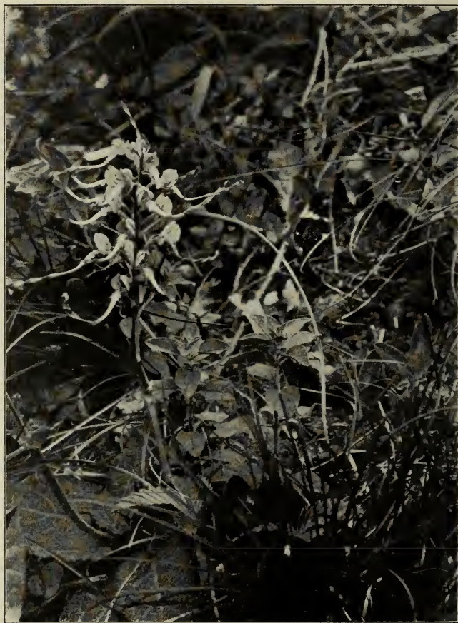
Fig. 1. Himantoglossum hircinum am Abhang des Büchsenberges im Kaiserstuhl.

Arten, ferner Dictamnus albus usw.) sowie zahlreiche Mediterranpflanzen ( Artemisia camphorata , Helianthemum fumana , Trinia glauca , Asperula glauca usw.) beobachtet werden konnten. Ein Teil der Gesellschaft fuhr noch auf den Hohneck und hatte dabei Gelegenheit, die Flora der Hochvogesen kennen zu lernen ( Anemone alpina , Narcissus pseudonarcissus ). Nachmittags resp. abends ging es wieder nach Freiburg zurück, wo man sich im Hotel National zu einem gemütlichen Zusammensein traf.