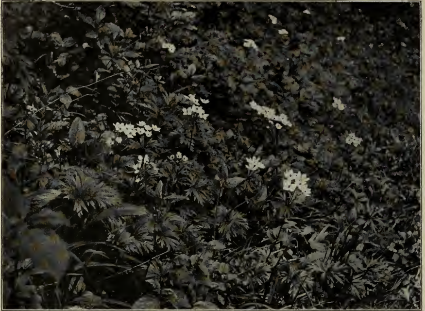
Fig. 3. Anemone narcissiflora bei Geisingen.