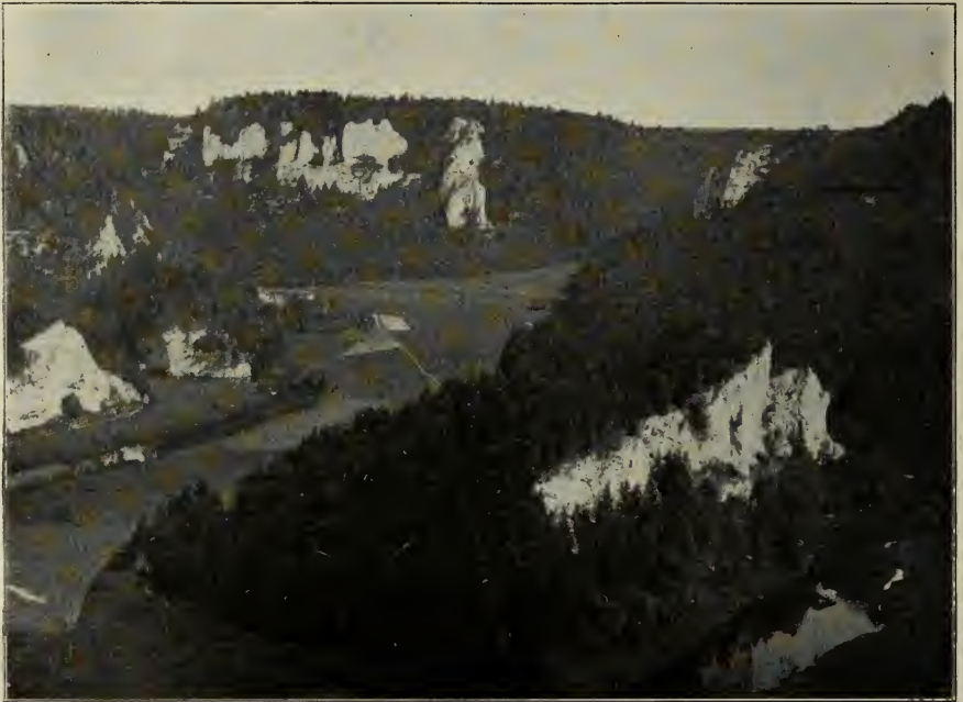
Fig. 6. Kalkfelsen im oberen Donautal zwischen Friedingen und Beuron.

Der folgende Tag, Sonnabend, 1. Juni, war der hochinteressanten Flora der Baar gewidmet, einer rauhen Hochfläche, die von der oberen Donau