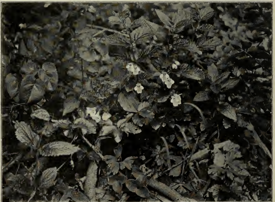
Fig. 4. Melittis melissophyllum bei Hintschingen.