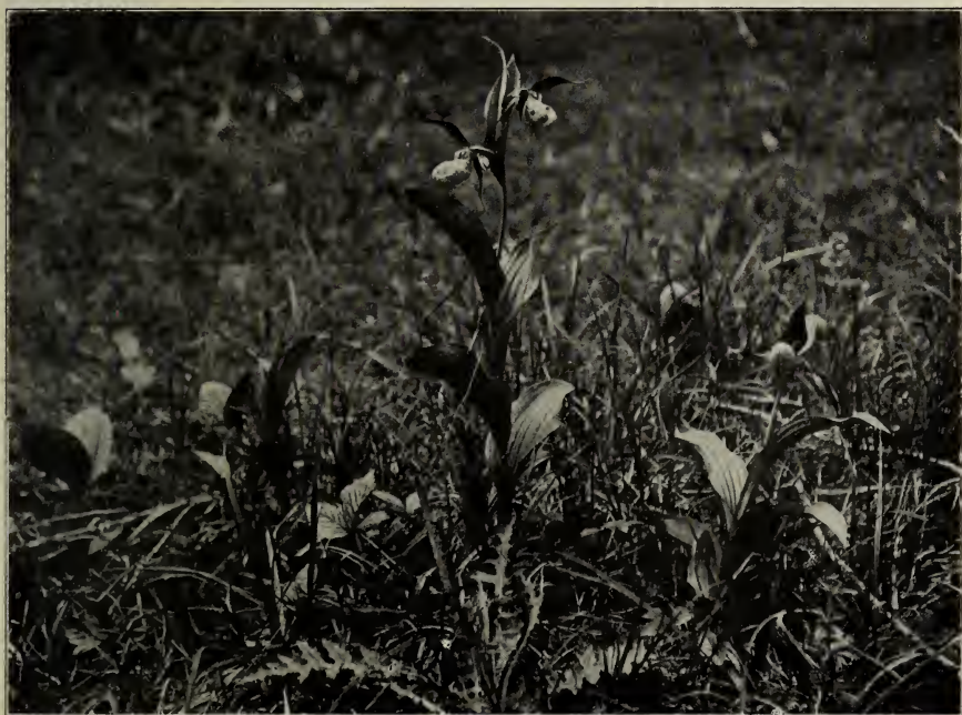
Fig. 2. Cypripedium calceolus im Dögginger Wald.

Die Reihe der Vorträge eröffnete Herr P. GRAEBNER-Berlin; er sprach über die Veränderungen natürlicher Vegetationsformationen ohne Klimawechsel. Auch dieser Vortrag wird in seinem ganzen Umfange nachstehend abgedruckt. Es berichtete sodann Herr L. DIELS-Marburg über seine Untersuchungen zur Pflanzengeographie von West-China; der Vortrag gelangt in etwas ausführlicherer Form zum Abdruck. Weiterhin sprach Herr H. GLÜCK-Heidelberg über: Oenanthe fluviatilis , eine verkannte Blütenpflanze des europäischen Kontinents; die Ausführungen sind ebenfalls im folgenden abgedruckt.