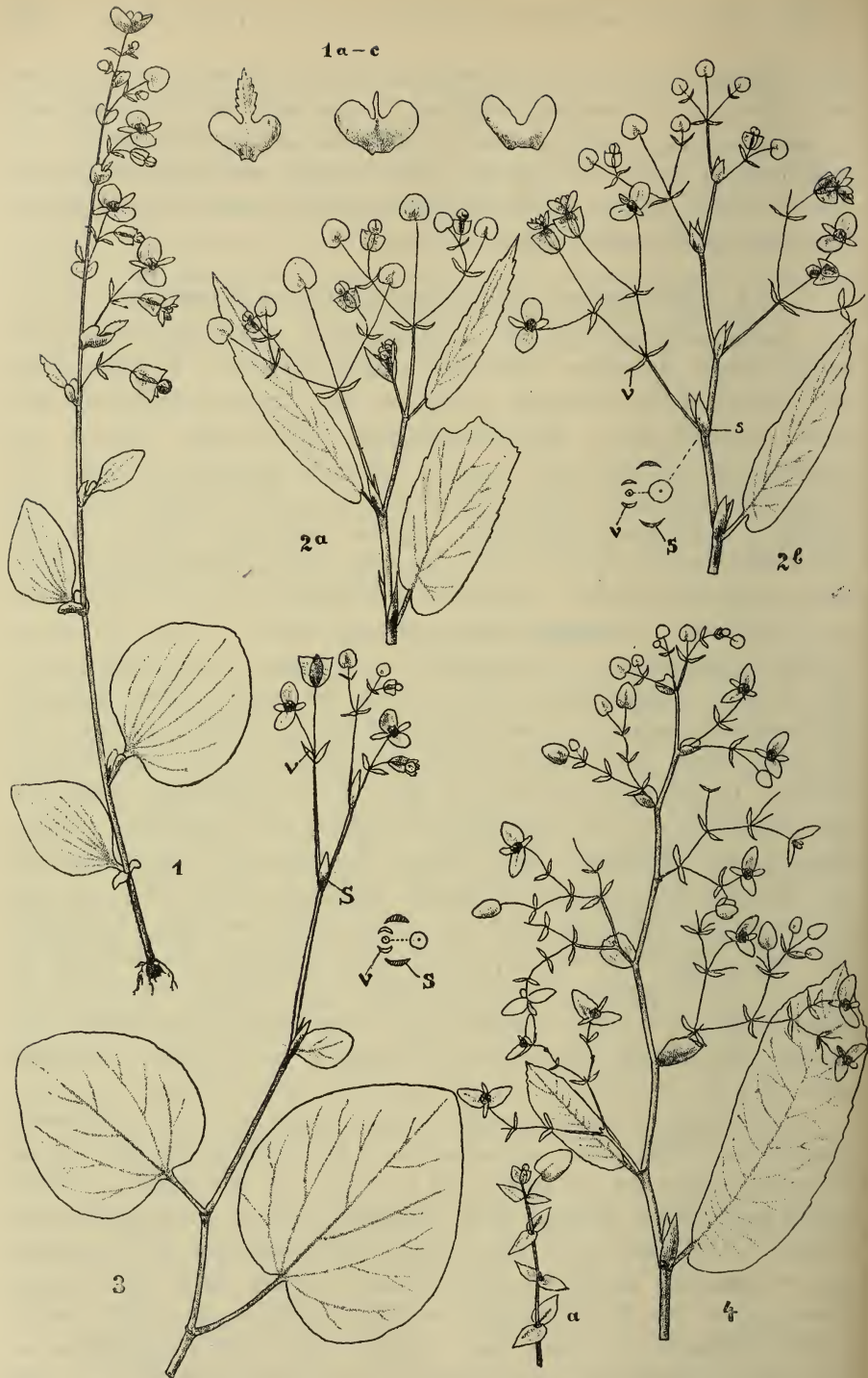
Fig. 4. 1 Begonia bicolor Watson, a—c Pseudobrakteen; 2a—b B. pedunculosa Wall.; 3 B. guttata Willd.; 4 B. urticaefolia (Kl.), a Partialwickel. — E. IRMSCHER delin.