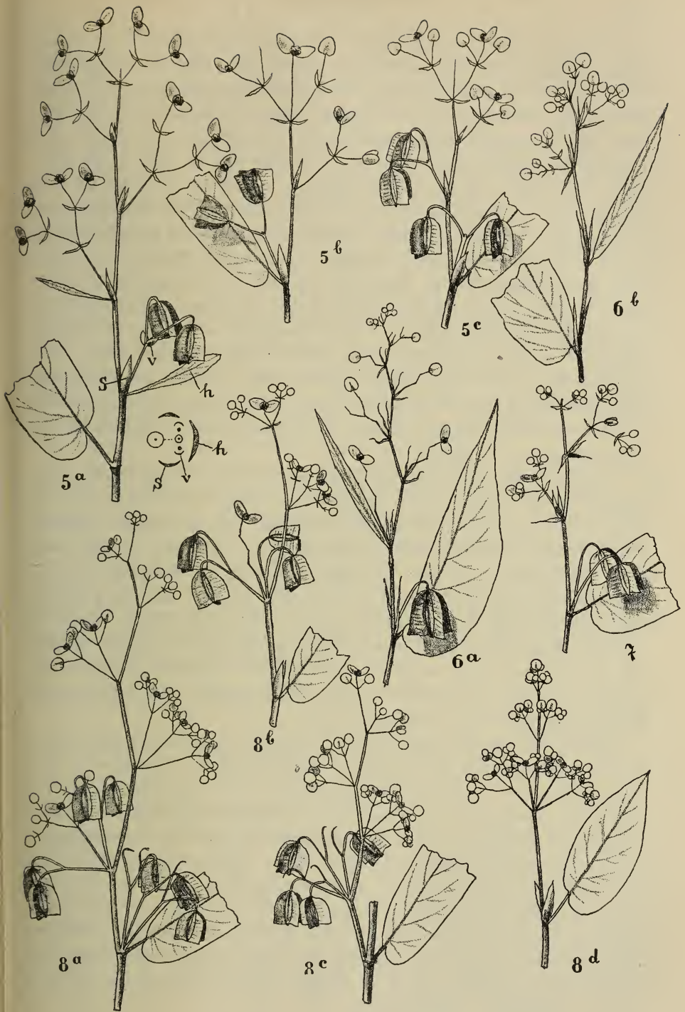
Fig. 2. 5a—c Begonia hirsuticaulis Irmscher, 6a, b B. filibracteosa Irmscher, 7 B. Gilgiana Irmscher, 8a—d B. naumoniensis Irmscher. — E. IRMSCHER delin.