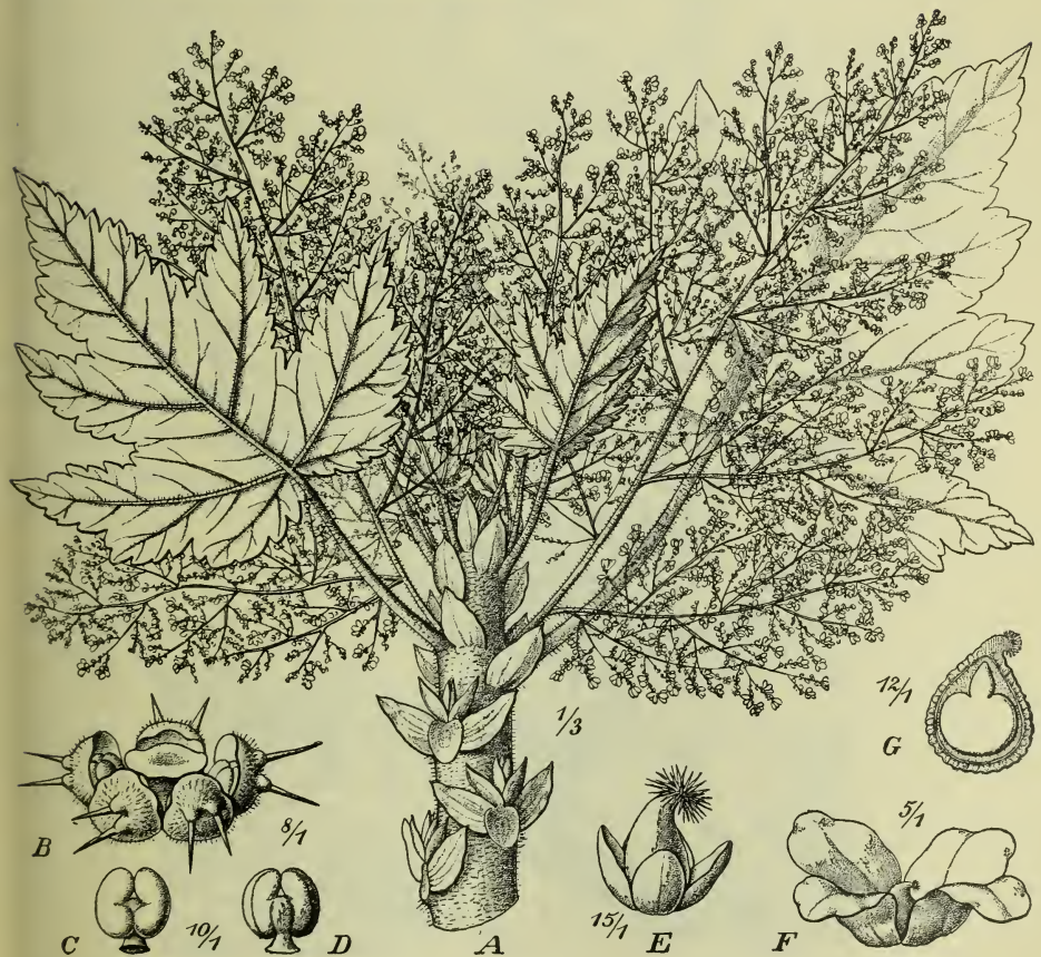
Fig. 1. Obetia pinnatifida Bak. A Stammspitze, \frac{1}{3} nat. Gr.; B ♂ Blüte; C Anthere von vorn; D dieselbe von hinten; E ♀ Blüte; F Fruchthülle; G Längsschnitt durch die Frucht und den Samen.

Von dieser Gattung war bisher aus Madagaskar und Ostafrika Obetia pinnatifida Baker (Journ. Linn. Soc. XX [1883] 264) bekannt. Es ist dies ein mit einfachem fleischigem Stamm versehener, bis 6 m hoher