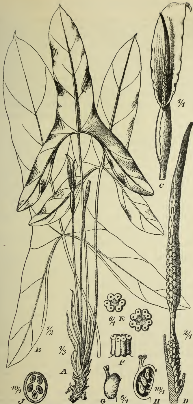
Fig. 3. Alocasia angustiloba Engl. A Habitus, B Blattspreite, C Infloreszenz, D Kolben, E ♂ Blüten von oben, F dieselbe von der Seite, G Pistill, H dasselbe im Längsschnitt, J dasselbe im Querschnitt. — Original.