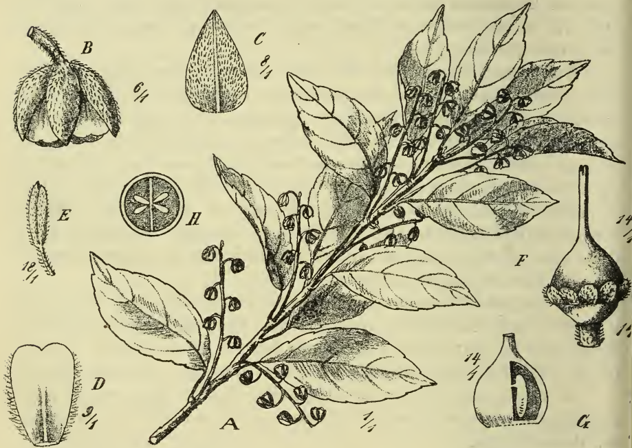
Fig. 3. Elaeocarpus bilobatus Schltr. A Zweig, B Blüte, C Kelchblatt, D Petalum, E Staubblatt, F, G, H Fruchtknoten.

4. E. bilobatus Schltr. n. sp. — Arbor erecta, ramosa, ramis ramulisque dense foliatis, glabratis. Folia elliptica, obtuse acuminata, basi cuneata, margine crenata, utrinque glabra, petiolo glabro. Racemi axillares, laxe 4—7-flori, quam folia vulgo subduplo breviores. Flores nutantes, 4-meri,