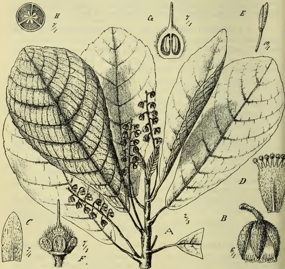
Fig. 4. Elaeocarpus heptadactylus Schltr. A Zweig, B Blüte, C Kelchblatt, D Petalum, E Staubblatt, F, G, H Fruchtknoten.

Unter den Arten mit fast kahlen Blättern in der Sektion durch die 8—9-spaltigen Petalen verschieden. Dieses Merkmal der Mehrspaltung teilt sie mit E. heptadactylus Schltr.