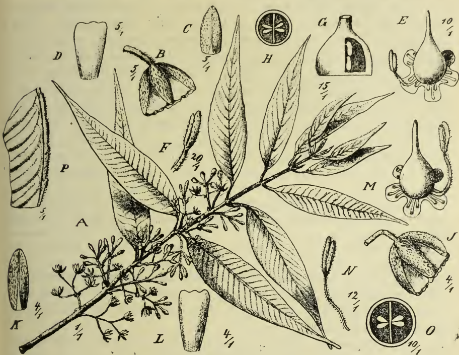
Fig. 1. A—H Sericolea micans Schltr. A Zweig, B Blüte, C Kelchblatt, D Petalum, E Fruchtknoten mit Diskus, F Staubblatt, G—H Fruchtknoten. — J—P S. chryso-tricha Schltr. J Blüte, K Kelchblatt, L Petalum, M Fruchtknoten mit Diskus, N Staubblatt, O Fruchtknoten-Querschnitt, P Blattrand.

superne glabrata, subtus pilis aureo-fulvis dense sericea, petiolo brevi, sericeo. Racemi abbreviati perbrevisiter pedunculati 4—7-flori, foliorum dimidium haud excedentes, pedicellis filiformibus aureo-sericeis. Flores parvuli, nutantes, 5-meri. Sepala oblongo-lanceolata, obtusiuscula, extus sericea, intus brevissime puberula, medio longitudinaliter carinato-incrasata. Petala sepalis paululo tantum longiora cuneato-obovata, apice truncata et brevissime trilobulata, utrinque glabra. Stamina 15, generis, filamentis filiformibus, minute papilloso-puberulis, antheris oblongoideis ob-