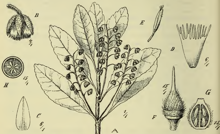
Fig. 6. Elaeocarpus polydactylus Schltr. A Zweig, B Blüte, C Kelchblatt, D Petalum, E Staubblatt, F, G, H Fruchtknoten.

var. podocarpoides Schltr. n. var. — Differt a forma typica foliis majoribus margine minus crenulatis, subintegris, usque ad 12 cm longis, medio 4 cm latis; racemis usque ad 12 cm longis.