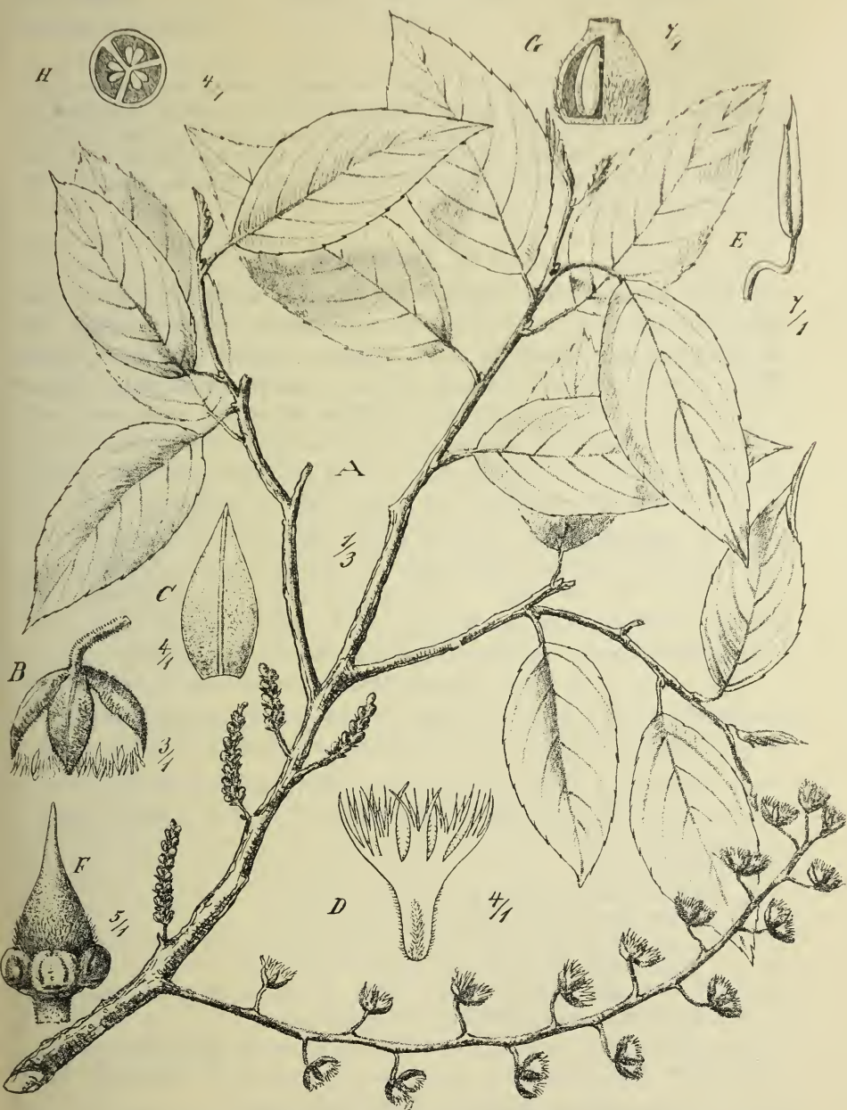
Fig. 5. Elaeocarpus multisectus Schltr. A Zweig, B Blüte, C Kelchblatt, D Petalum, E Staubblatt, F, G, H Fruchtknoten.