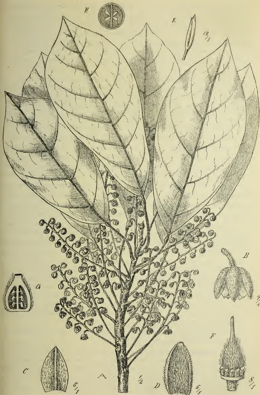
Fig. 7. Elaeocarpus clethroides Schltr. A Zweig, B Blüte, C Kelchblatt, D Petalum, E Staubblatt, F, G, H Fruchtknoten.