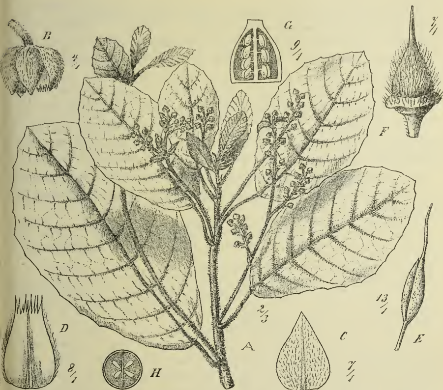
Fig. 8. Elaeocarpus fuscus Schltr. A Zweig, B Blüte, C Kelchblatt, D Petalum, E Staubblatt, F, G, H Fruchtknoten.

Eine äußerst charakteristische Art mit eigentümlicher gelbbrauner sehr kurzer Behaarung auf der Blattunterseite, wie ich sie sonst unter den papuasischen Arten noch nie beobachtet habe. (Fig. 8.)