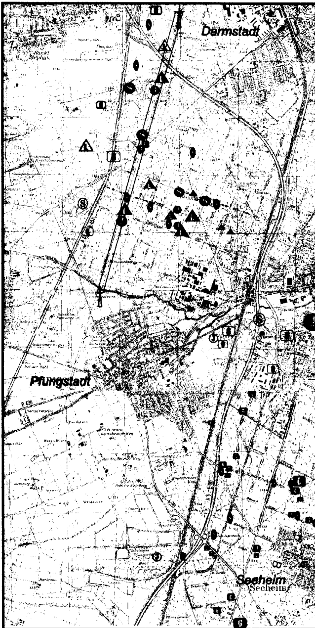
Abbildung 2: Verbreitung stark gefährdeter Arten im Gebiet zwischen Darmstadt, Seeheim und Pfungstadt; nach Jung 1992, Breyer 1993, 1994 & 1996, Hillesheim-Kimmel 1995, Köwing 1997 und Schwarzwälder 1998. Kartengrundlagen: TK25 6117 & 6217. Bei mit ? gekennzeichneten Vorkommen fehlen exakte Angaben zum Standort und zur Anzahl.