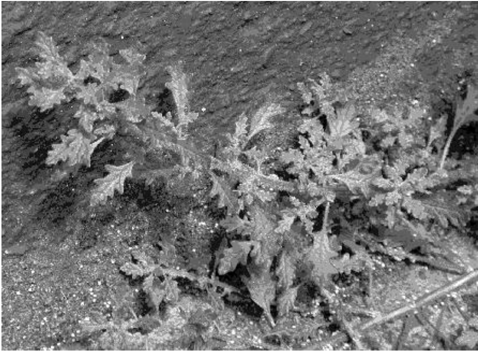
Abbildung 1: Der Australische Gänsefuß ( Chenopodium pumilio ) an einem Mauerfuß im alten Ortskern von Frankfurt-Seckbach, 2003.

Das Erlöschen von Populationen des Australischen Gänsefußes ist eher die Ausnahme, obwohl die Art häufig auf Standorten wächst, die sehr starken Veränderungen unterworfen sind. Bereits Buttler (1959: 3) befürchtete: „Das seltene Unkraut wird seinen Wuchsort am Flughafen wohl kaum behaupten können, da ihm nach Beendigung der Bauarbeiten der Lebensraum genommen werden wird.“ Chenopodium pumilio ist jedoch sehr viel hartnäckiger als damals erwartet wurde. Die Umgebung des Frankfurter Flughafens stellt bis heute einen Schwerpunkt der Verbreitung in Südhessen dar. Die Ergebnisse dieser Untersuchung zeigen, dass die Art bei entsprechend genauer Fundortangabe oft noch nach Jahrzehnten an derselben Stelle oder in direkter Nähe gefunden werden kann.