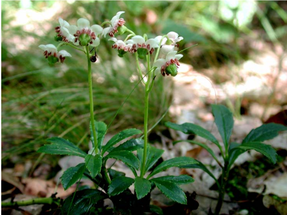
Abbildung 4: Blühende Chimaphila umbellata im Eichenwald östlich Babenhausen; 26. Juni 2008.

In der nachfolgenden Verbreitungsübersicht (Abbildung 5) sind alle bekannten hessischen Fundorte zusammengestellt und nach Möglichkeit den Viertelquadranten der TK 25 zugeordnet. Dabei wurde unterschieden in frühere Angaben und Beobachtungen im Rahmen des Projektes aus dem Jahre 2008. Nach der Literatur und den Herbarbelegen gibt es Angaben zu immerhin 17 Messtischblättern; dabei verteilen sich die Fundorte auf 37 Viertelquadranten und auf vier Quadranten (unpräzise Ortsangaben). Auf sechs der Rasterfelder konnten Angaben für Chimaphila umbellata bestätigt werden. In ganz Hessen wurden noch neun Vorkommen in vier Gemarkungen beobachtet.