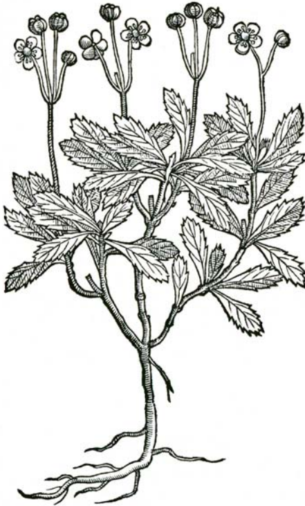
Abbildung 3: Älteste Darstellung von Chimaphila umbellata (Clusius 1583).

wesentlichen Verbreitungsgebiete von Chimaphila umbellata in Hessen Ende des 18. Jahrhunderts bekannt: Kiefernwälder auf Sand in der nördlichen Oberrheinebene und in der östlichen Untermainebene. Im 19. Jahrhundert werden dann noch Vorkommen im westlichen Vogelsberg, der Rhön und in den südhessischen Kiefernwäldern nahe der badischen Landesgrenze entdeckt. In Westhessen (Taunus, Westerwald, Gladenbacher Bergland) sowie Nord- und Nordosthessen (Waldeck, Reinhardswald, Schwalm und Fulda-Werra-Bergland) ist Chimaphila niemals vorgekommen (siehe zum Beispiel Nieschalk 1957).