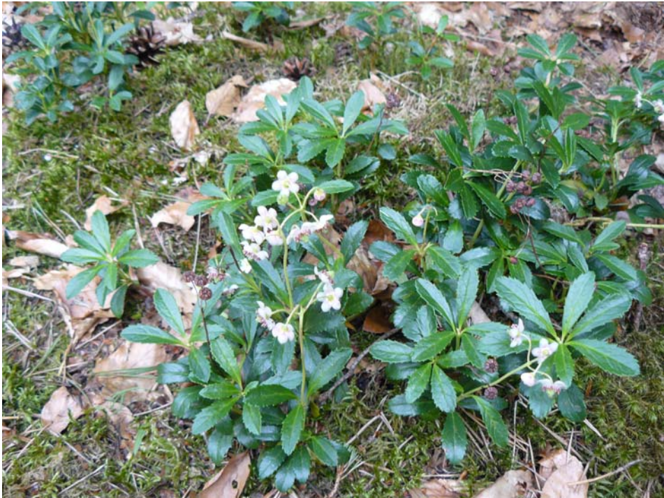
Abbildung 6: Dichter Chimaphila -Trupp in Zellhausen (Wuchsort Nummer 4) mit Blütenständen am Ende der mit Blattrosetten versehenen Triebe. Dazwischen vorjährige Fruchtstände ohne Rosetten. 25. Juni 2008.

Insgesamt konnten 103 Blühtriebe mit jeweils bis sechs Blüten, zusammen 370 Einzelblüten gezählt werden, dabei überwiegen drei- bis fünfblütige Dolden(trauben). In der Tabelle nicht enthalten sind die hin und wieder noch vorhandenen Fruchtstände des Vorjahres.