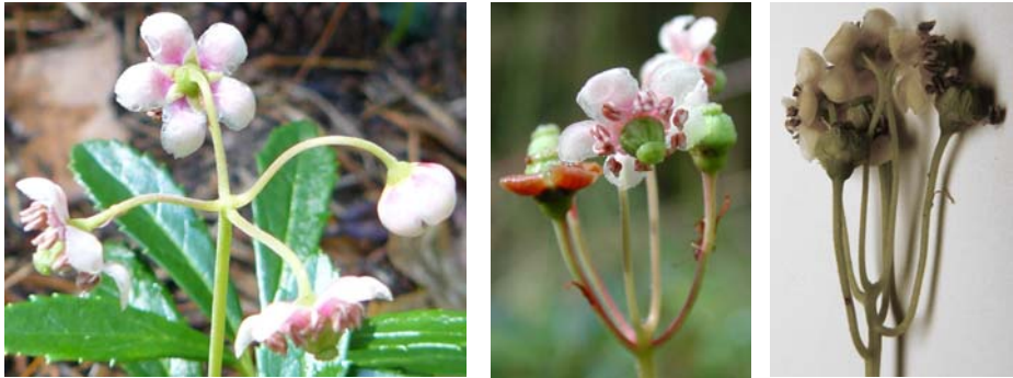
Abbildung 1: Übergang vom doldigen (links mit 4 Blüten) zum doldentraubigen Blütenstand (rechts mit 6 Blüten) bei zunehmender Blütenzahl, alle Fotos 26. Juni 2008.

dass mit zunehmender Blütenzahl der Blütenstand doldentraubig und nicht mehr doldig ausgebildet ist (siehe Abbildung 1).