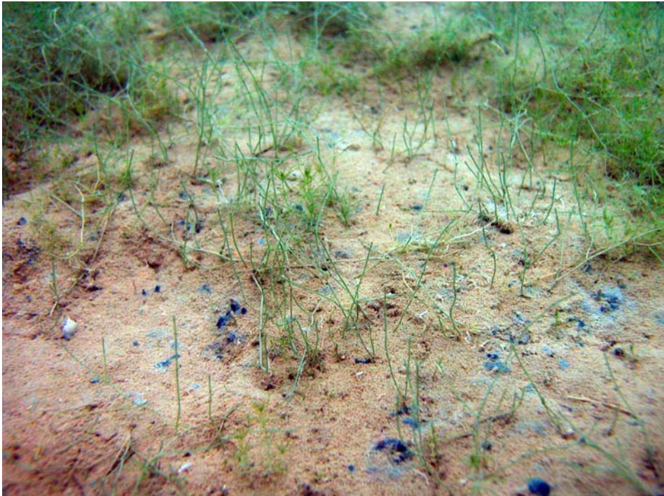
Abbildung 3: Faden-Armleuchteralge ( Chara filiformis ) im Borkener See; 2009, Egbert Korte.