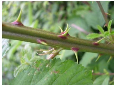
Abbildung 3: Die Winkel-Brombeere ( Rubus goniophorus ) aus der Serie Discolores ist eine häufige Art in den Pruno-Rubion-Gesellschaften des Untersuchungsgebietes. Charakteristisch sind die rotfüßigen, häufig zur Sprossspitze hin gekrümmten Stacheln und weiße Blütenblätter (Linsengericht-Großenhausen, 23. 6. 2010).