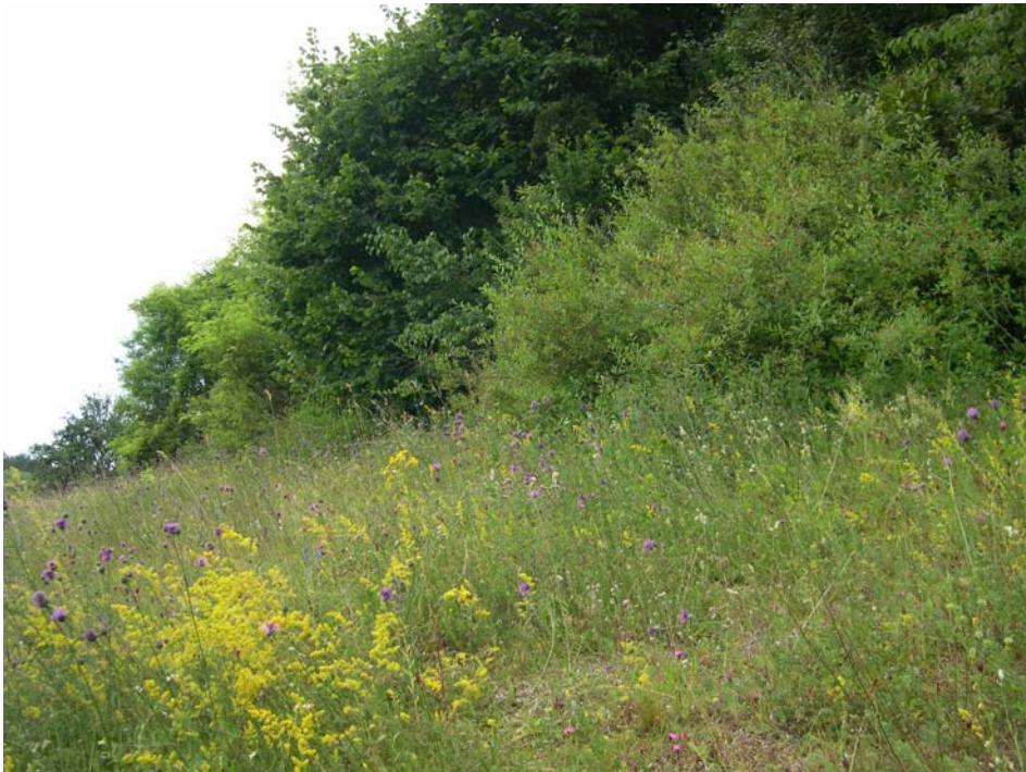
Abbildung 4: Als Mantelgebüsch ausgeprägtes Pruno-Ligustretum im Kontakt zu einer Mesobromion-Gesellschaft am Grauen Berg bei Gelnhausen-Hailer (Aufnahme Nr. 6, 11. 7. 2010).