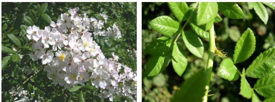
Abbildung 2: Die Vielblütige Rose ( Rosa multiflora ) ist im Meerholzer Hügelland ein weit verbreiteter Neophyt. Linkes Bild: Blühender Strauch bei Freigericht-Bernbach (16. 6. 2010). Rechtes Bild: Ein wichtiges vegetatives Merkmal sind die zerschlitzten Nebenblätter (Bildmitte), die die Art von anderen einheimischen Wildrosen unterscheiden (nicht blühender Trieb bei Hasselroth-Gondsroth, 18. 8. 2009).

nährstoffarmen Schlehengebüsch des Untersuchungsgebietes vor (vergleiche Tabelle 2). Bei der erwähnten Ausnahme (Aufnahme 13) handelt es sich um ein durch Nährstoffeintrag einer benachbarten Ackerfläche eutrophiertes Berberidion-Gebüsch. Während die Vorkommen von Rosa micrantha alle als indigen zu betrachten sind, wird Rosa rubiginosa häufiger auch gepflanzt, zum Beispiel in künstlich angelegten Gebüsch am Rand von Straßen oder auch im Bereich von Streuobstwiesen. Die in Tabelle 2 dokumentierten Vorkommen wurden als spontan oder subspontan eingestuft.