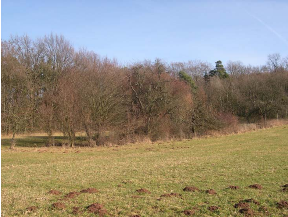
Abbildung 6: Entstehung einer linearen Prunetalia-Gesellschaft entlang einer nicht mehr genutzten Obstbaumreihe. Das umgebende Grünland wird regelmäßig gemäht. Im Unterwuchs haben sich vor allem Cornus sanguinea und Prunus spinosa eingestellt (Hasselroth-Niedermittlau, 9. 2. 2011).

Origanum vulgare und Agrimonia procera gekennzeichnet. Die vorherrschende Assoziation ist das Trifolio-Agrimonietum eupatorii.