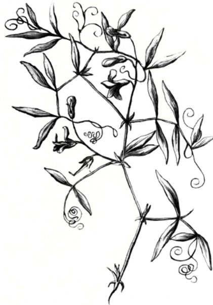
Abb.: 2 Die älteste Abbildung der Sumpf-Platterbse stammt von dem aus Gießen stammenden Botaniker Heinrich Bernhard Rupp (1688–1719). – The oldest known image of Lathyrus palustris , by the Hessian botanist Heinrich Bernhard Rupp.