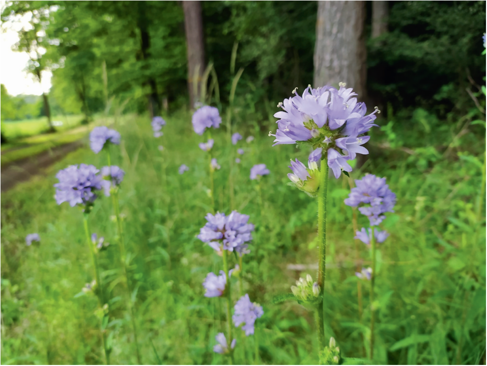
Abb. 4: Campanula cervicaria am Habertshäuser Berg südlich Ober-Gleen; 7. 7. 2021. – Campanula cervicaria south of Ober-Gleen at Habertshäuser Berg.