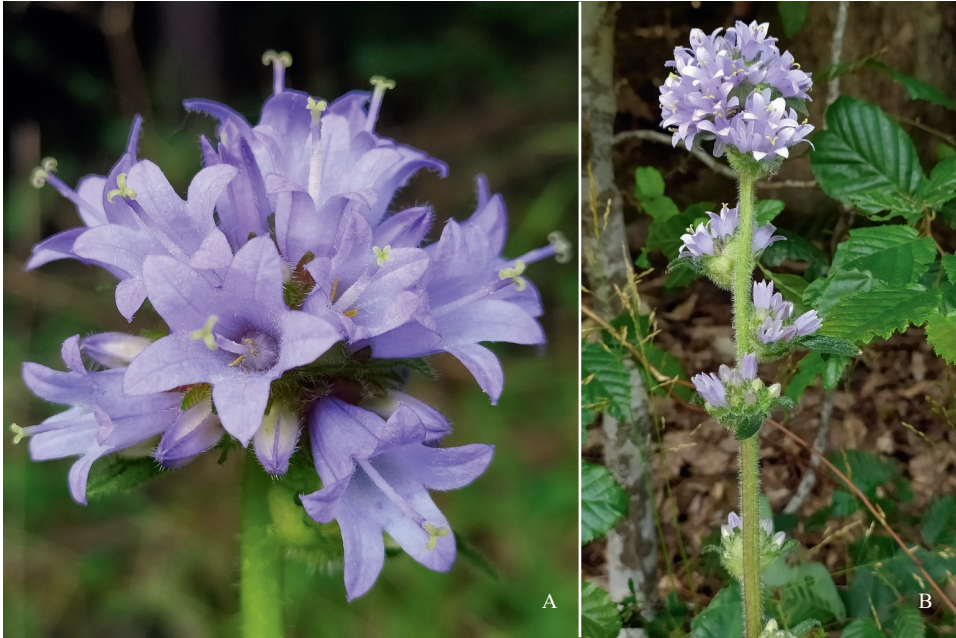
Abb. 1: A: Blütenstand von Campanula cervicaria , Ober-Gleen; 7.7.2021. B: Borstiger Stängel von Campanula cervicaria mit Blütenstand; Jossa; 26.6.2022. – A: Inflorescence of Campanula cervicaria in Ober-Gleen (Hesse, Vogelsberg county). B: Bristly stem of Campanula cervicaria with inflorescence in Jossa (Hesse, Main-Kinzig county).

Blütezeit ist von Ende Juni bis Ende Juli, es können sich aber auch Nachblüten bis in den September hinein entwickeln. Gelegentlich wird Campanula cervicaria mit C. glomerata verwechselt, die aber keinen borstigen Stängel besitzt und in deutlich anderen Habitaten wie Trockenrasen, magere Wiesen etc. vorkommt.