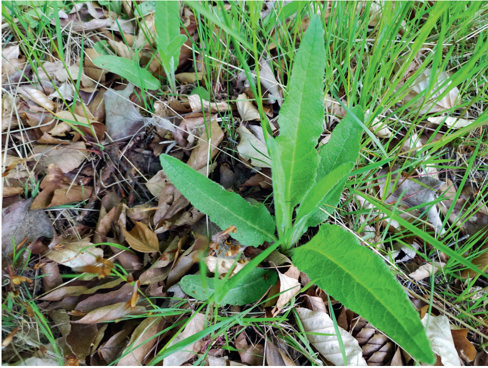
Abb. 2: Grundblätter von Campanula cervicaria ; 13. 5. 2022, Ober-Gleen. – Basal leaves of Campanula cervicaria .