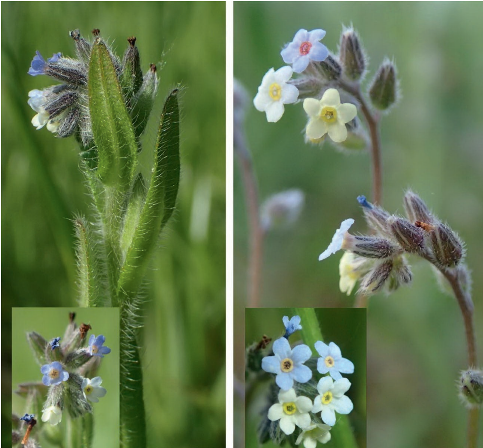
Abb. 35/259: Myosotis dubia (links) und M. discolor im Vergleich; Rödermark.

35/259 ; 6018/23; 3483798/5537203; SW; Messeler Hügelland; Offenbach; Rödermark; westlich Urberach, Erlenseeloch, lückige Nasswiese, Flutrasen; 244 m ü. NN; sehr zahlreich, zusammen mit Montia arvensis , Glyceria declinata und Myosurus minimus ; 6. Mai 2015 (zuletzt 2021); Herbar- und Fotobeleg 22755.