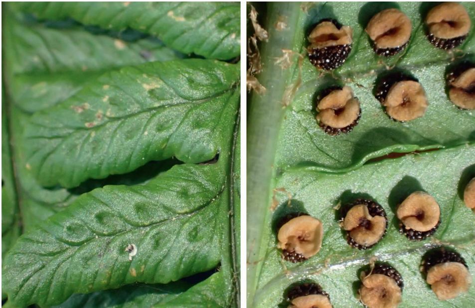
Abb. 35/233: Dryopteris affinis subsp. punctata . Makrofotos der Ober- und Unterseite der Fiederchen mit charakteristischen „Dellen“ und derben Indusien; Neunkirchner Höhe.

Neu für Hessen! Die Verwandtschaft von Dryopteris affinis bereitet erhebliche Bestimmungsprobleme. Die Form der Fiederchen, das derbe Indusium und die deltenartigen Mulden auf der Gegenseite der Sori (Blattoberseite) gelten aber als sehr charakteristisch für die hier mitgeteilte Unterart. Sie war in Deutschland bisher nur im Allgäu gefunden worden (Freigang & Zenner 2007, Ber. Bot. Arbeitsgem. Südwestdeutschland 4, 37–64). Im Odenwald kommen also alle aus Deutschland bekannten und gültig benannten Formen vor. Manche sind allerdings nur aus dem badischen Teil sicher nachgewiesen ( D. cambrensis , D. lacunosa : beide bei Heidelberg). Auch D. pseudodisjuncta ist sehr selten (Melibocus, Reisenbacher Grund). Die typische Unterart ( D. affinis subsp. affinis ) ist im Odenwald ebenfalls nicht häufig, aber weiter verbreitet, wobei der Verbreitungsschwerpunkt im Süden (Neckartal und Seitentäler) liegt. Öfters zu finden ist dagegen D. borrieri .