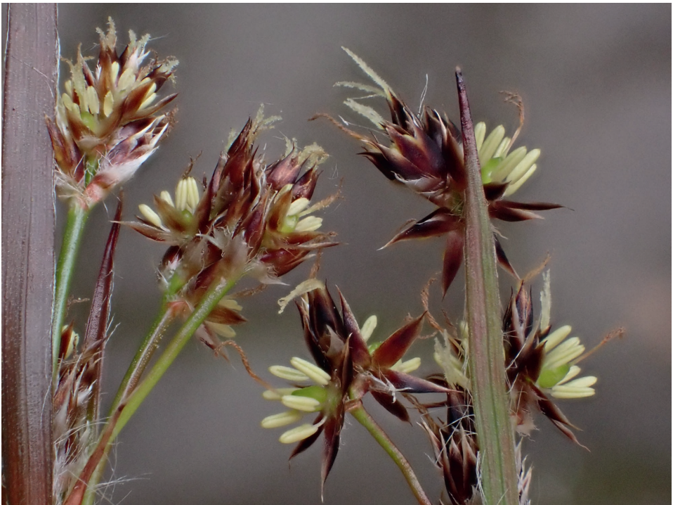
Abb. 35/255: Luzula multiflora (links) und L. divulgata im Vergleich; man beachte die Antheren- und Tepallänge; Bergstraße, Odenwald.

Pflanzen anderer Arten und Herkünfte wurde der Nachweis letztlich abgesichert. Verwendet wurden bergsträßer und „sichere“ L. divulgata aus Mitteldeutschland sowie zeitgleich blühender L. multiflora und L. campestris aus Wildvorkommen im Garten des Verfassers. Die Wuchsort an der Bergstraße lassen sich am ehesten als Habichtskaut-Traubeneichen-Wald (Hieracio-Quercetum) charakterisieren, in den exponiertesten Ausprägungen an der Orbishöhe auch als Potentillo-Quercetum. Dort kommen als Begleitarten Anthericum liliago , A. ramosum , Carex humilis und Calluna vulgaris dazu. Ergänzend wurden die Belege von Luzula multiflora im Herbarium Seckenbergianum (FR) durchgesehen. Unter Dutzenden Belegen sicherer L. multiflora fand sich einer, der zu L. divulgata gehört. Der Beleg wurde am 4. Mai 1954 von Karl Peter Buttler im bayerischen Vorspessart gesammelt, nämlich in der „Rückersbacher Schlucht“ nordöstlich Kleinostheim. Buttler hat den Beleg mit einem Vermerk versehen „( L. campestris ?) Staubblätter 2\frac{1}{2} \times s. l. wie Staubfäden!“. Er hatte also damals schon den richtigen Riecher bei der noch unbeschriebenen Art. Die Pflanzen wuchsen im Laubwald und waren häufig. Dies ist der erste Beleg der Art aus Nordwestbayern und ein starkes Indiz dafür, dass die Art weiter verbreitet ist.