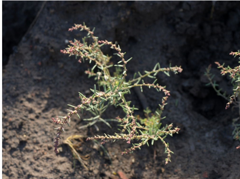
Suaeda maritima , Beienrode 2008

Der größte Anteil der genetischen Variation findet sich innerhalb der Populationen, während die genetische Differenzierung zwischen den Populationen vergleichsweise gering ist.