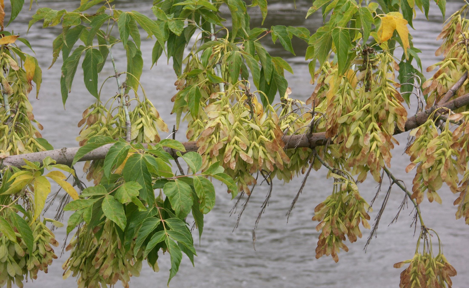
Acer negundo (Eschen-Ahorn) reichlich fruchtend In einer senkrechten Ufermauer der Elbe in Magdeburg