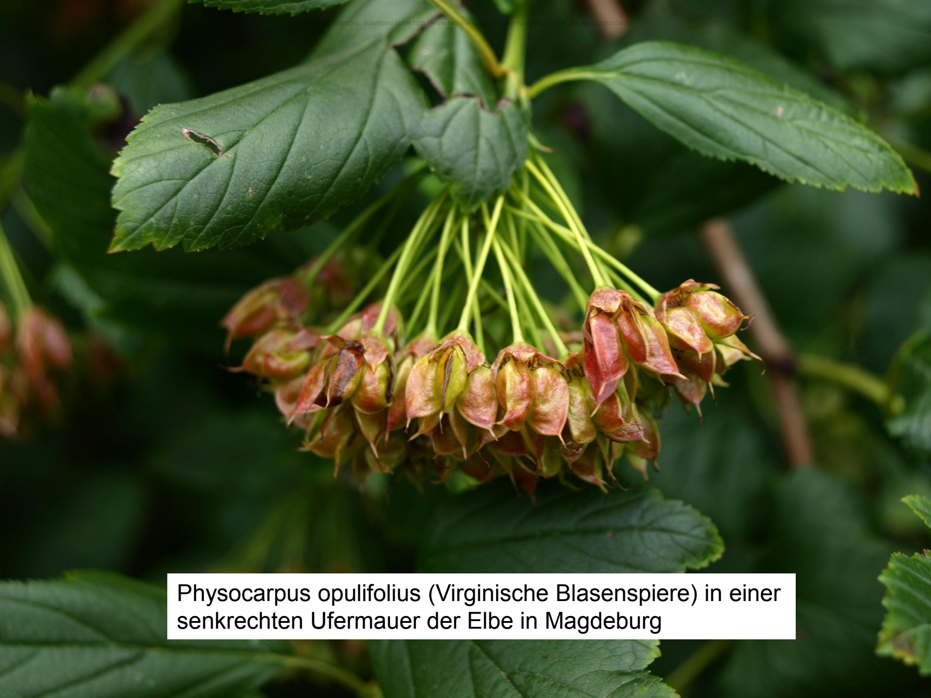
Physocarpus opulifolius (Virginische Blasenspiere) in einer senkrechten Ufermauer der Elbe in Magdeburg