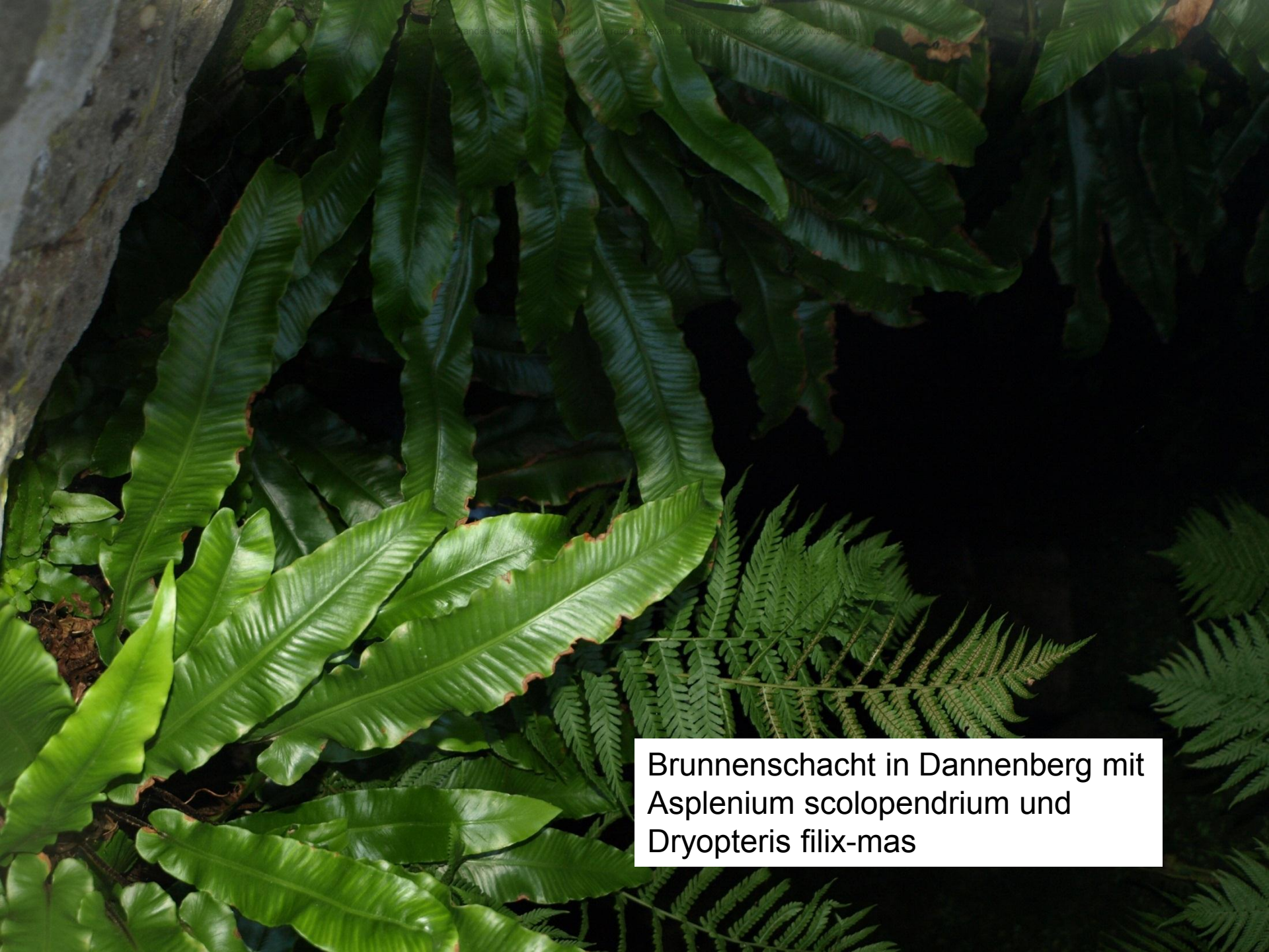
Brunnenschacht in Dannenberg mit Asplenium scolopendrium und Dryopteris filix-mas