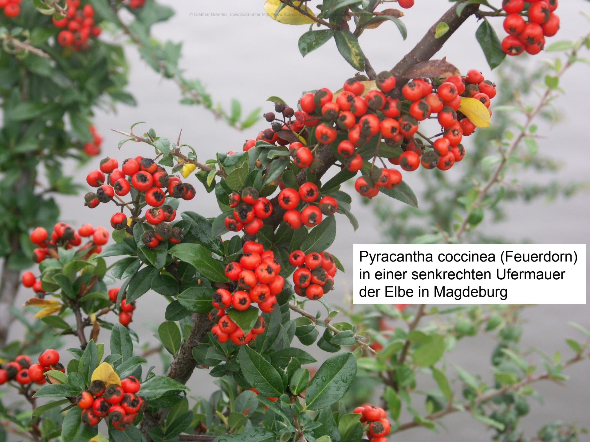
Pyracantha coccinea (Feuerdorn) in einer senkrechten Ufermauer der Elbe in Magdeburg