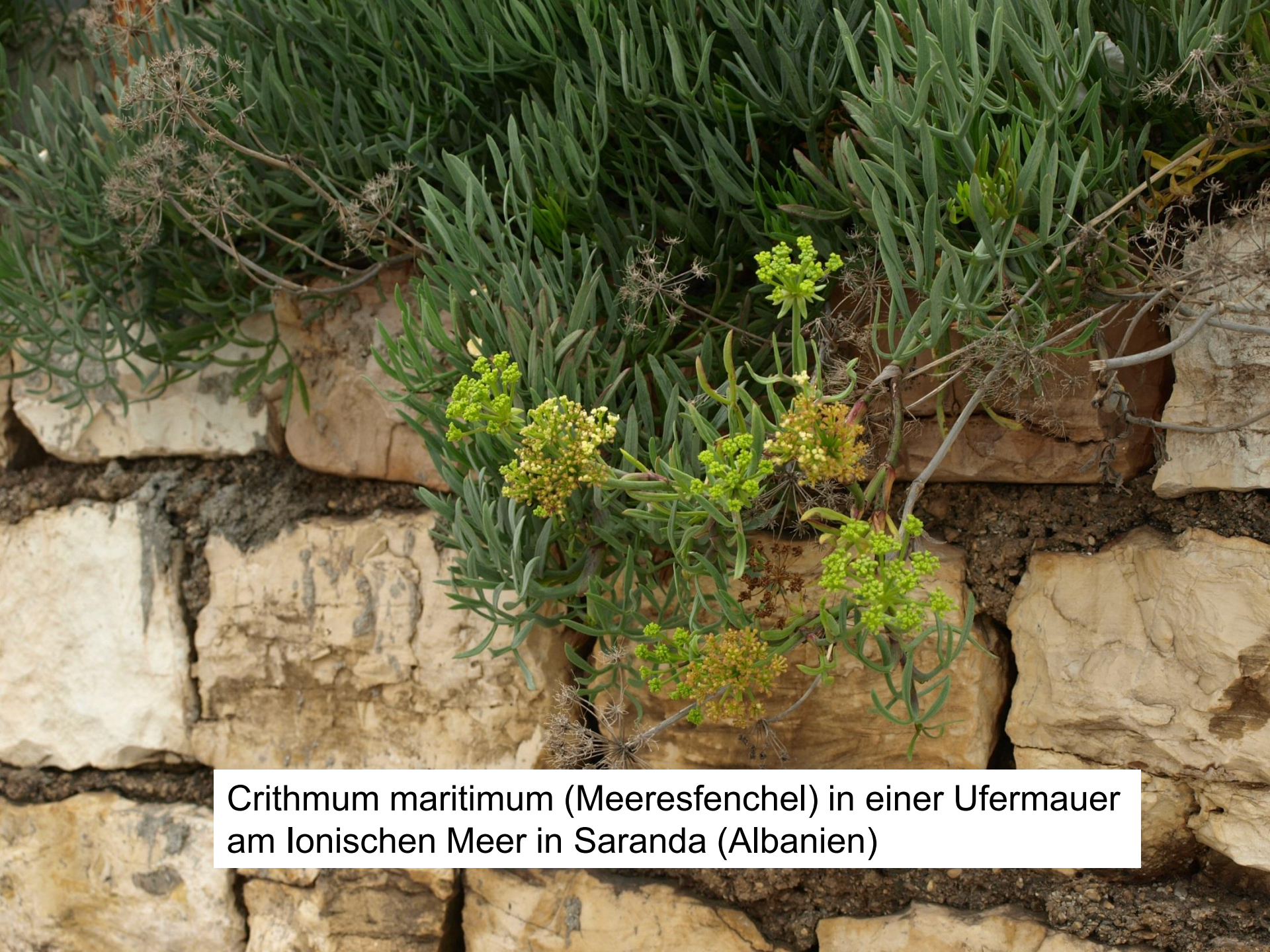
Crithmum maritimum (Meeresfenichel) in einer Ufermauer am Ionischen Meer in Saranda (Albanien)