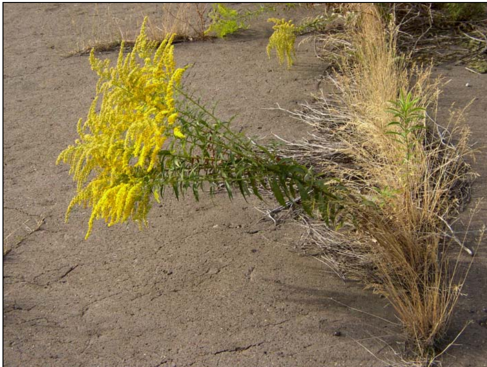
Abb. 9: Solidago canadensis in den Ritzen einer ehemaligen Ladestraße (September 2003).

Sonstige : 1.1 Clematis vitalba , + Cirsium arvense , + Hypericum perforatum , + Cerastium spec.