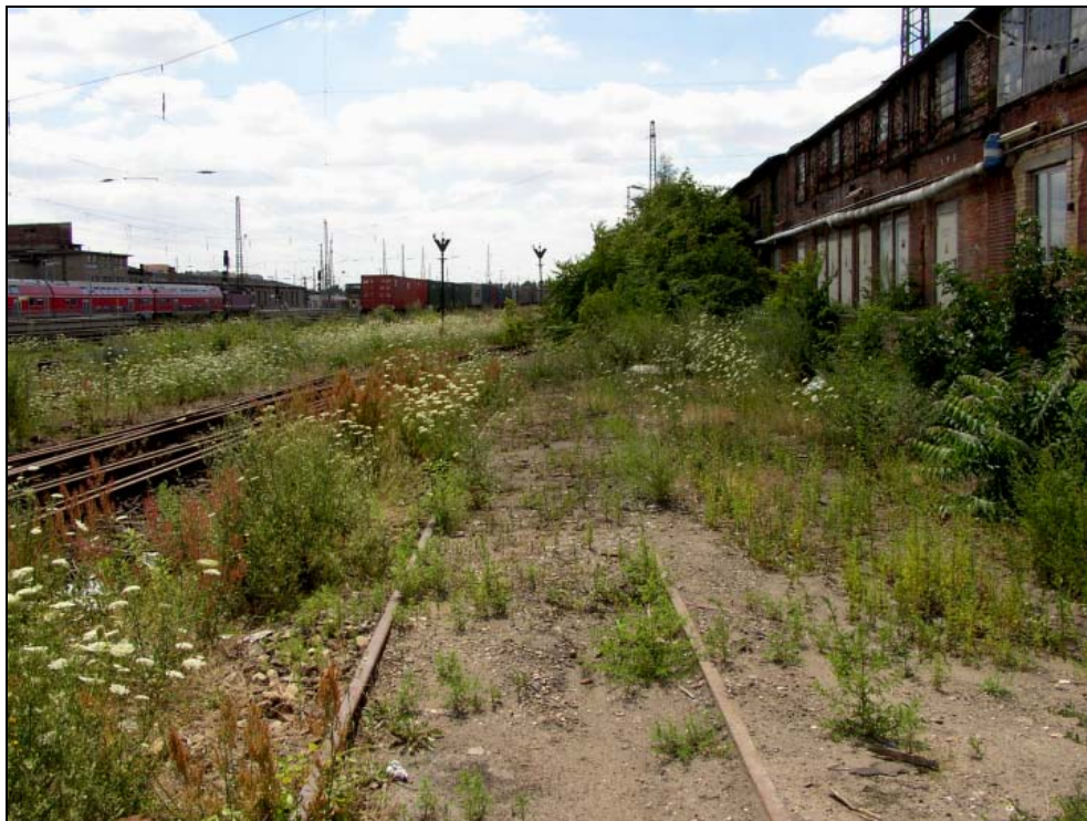
Abb. 13: Gehölze entwickeln sich vor allem entlang von Mauern sowie im Schutz von ungenutzten Gebäuden. Diese Pioniergehölze werden von Robinia pseudoacacia , Sambucus nigra und Ailanthus altissima gebildet.