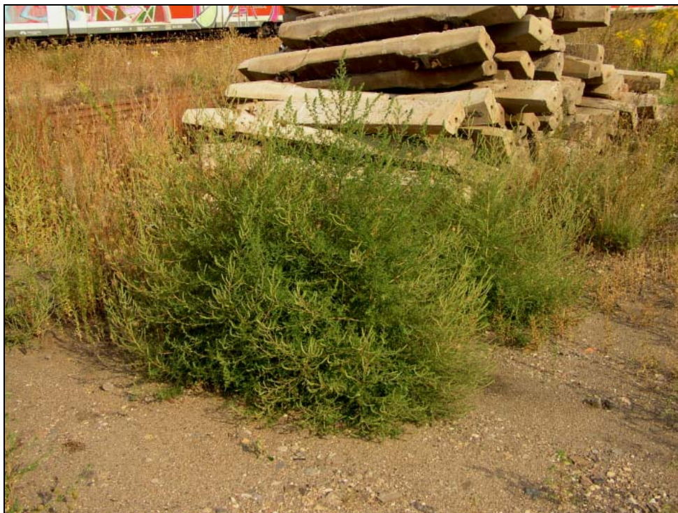
Abb. 4: Bassia scoparia ssp. densiflora um einen Haufen von Betonschwellen.