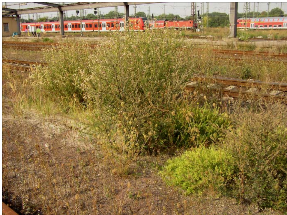
Abb. 7: Carduus acanthoides (abblühend), Reseda lutea und Artemisia vulgaris (August 2003).