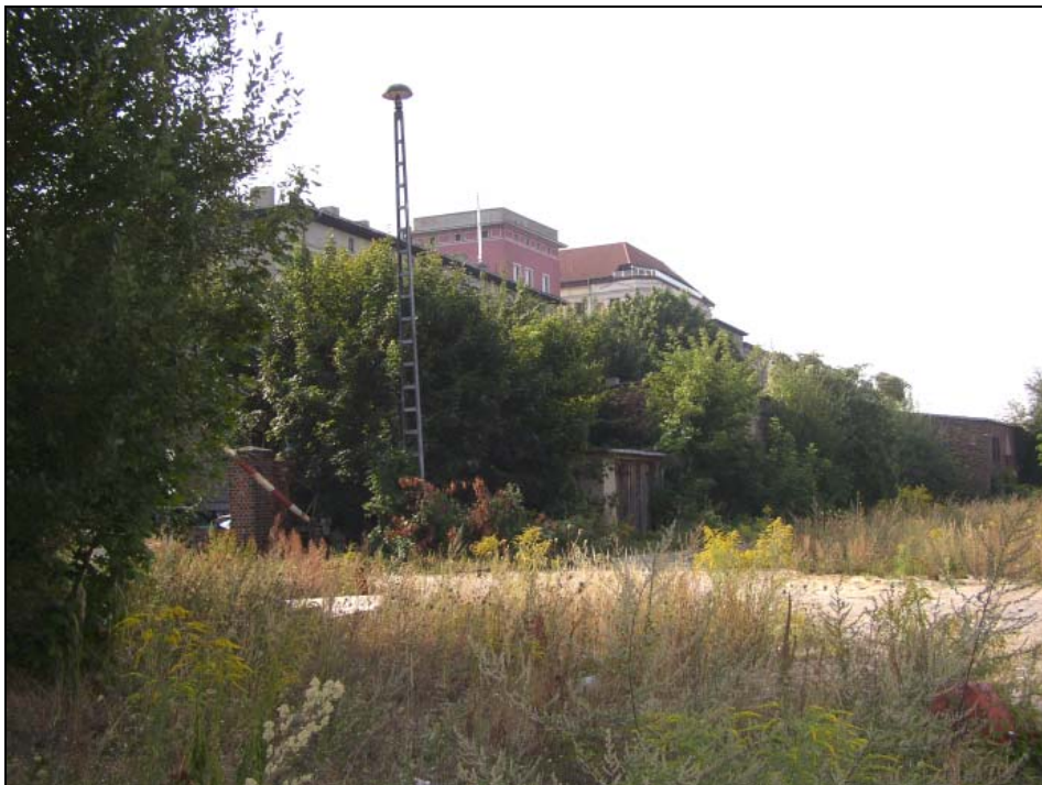
Abb. 11: Acer pseudoplatanus - Bestand entlang der Mauer an der Bahnhofstraße (August 2003): Samenregen der Straßenbäume von der Bahnhofstraße. Im Bestand finden sich auch Salix caprea , Populus x hybrida , Robinia pseudoacacia , Ailanthus altissima und Sambucus nigra .