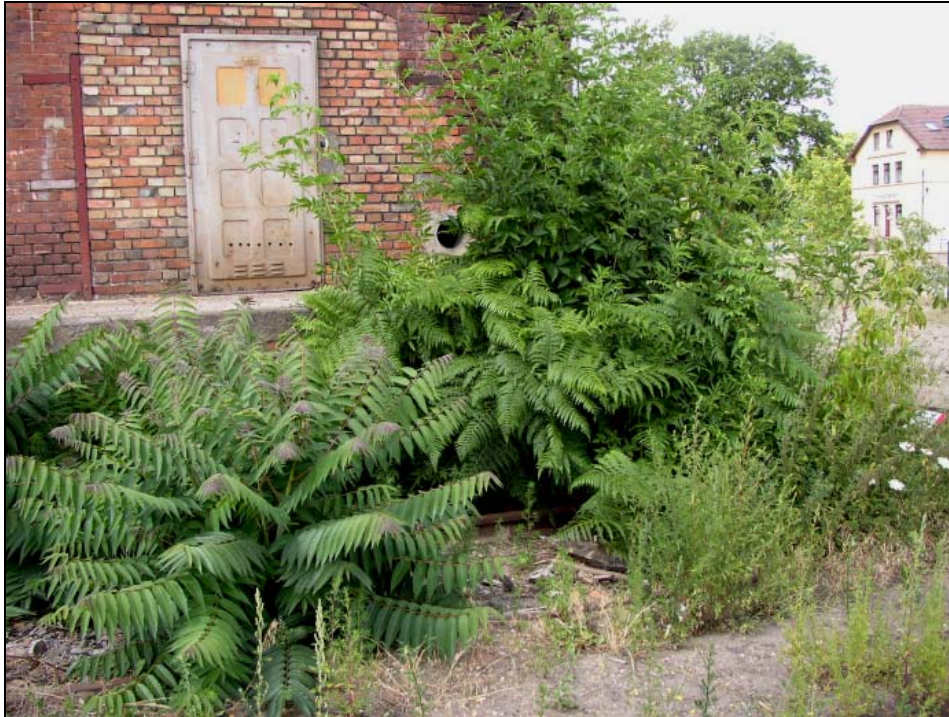
Abb. 14: Ailanthus altissima (Vordergrund links), Pteridium aquilinum und Sambucus nigra bilden eine ungewöhnliche Artenkombination auf einem ehemaligen Ladegleis vor einem Schuppen.