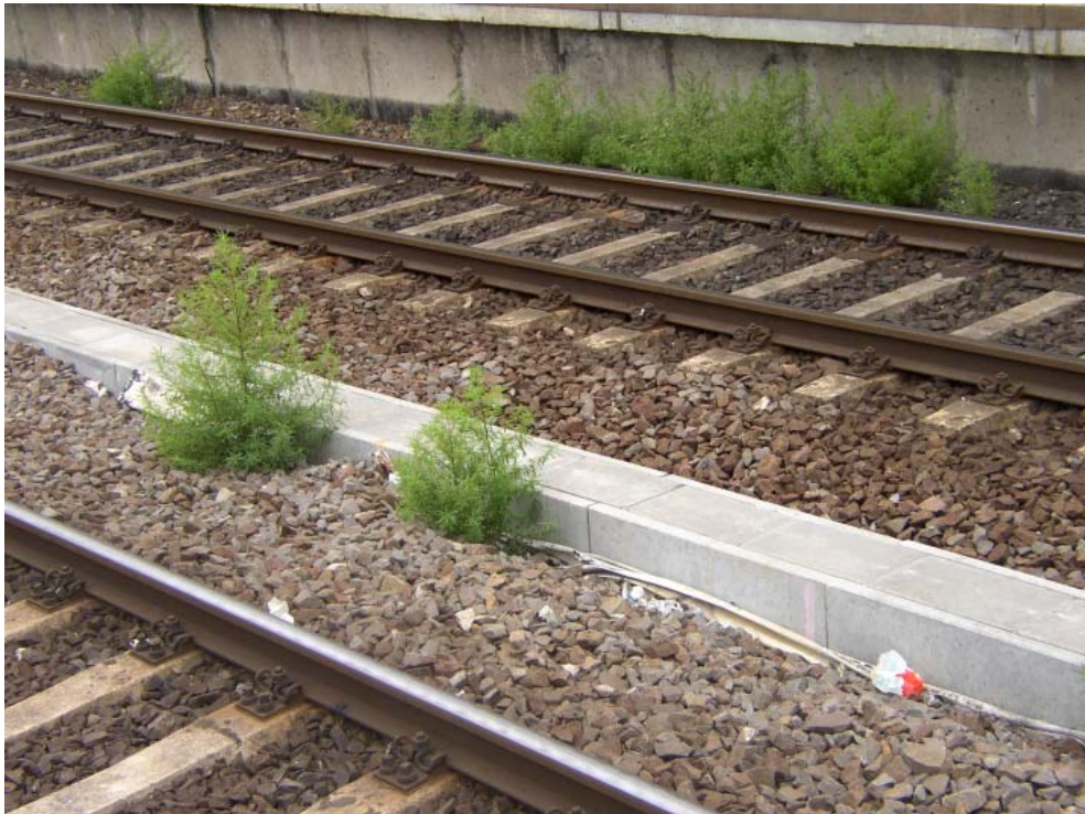
Abb. 4: Bassia scoparia ssp. densiflora hat sich seit ca. 20 Jahren zunehmend im Eisenbahnnetz Mitteldeutschlands ausgedehnt. Zusammen mit Amaranthus retroflexus , Salsola kali ssp. tragus und Senecio viscosus bildet die Besen-Radmelde charakteristische hellgrüne Bestände entlang der Gleise, hier im Bahnsteigsbereich des Hauptbahnhofs.