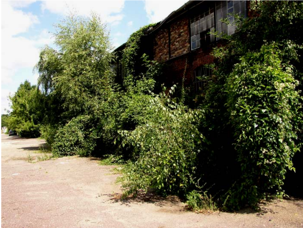
Abb. 12: Sambuco-Salicion-Gebüsche mit Betula pendula , Salix caprea , Sambucus nigra und Clematis vitalba säumen ehemalige Schuppen auf dem aufgelassenen Betriebsgelände an der Maybachstraße.