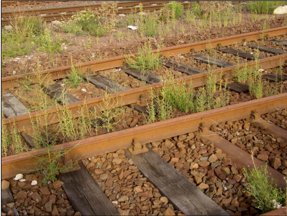
Abb. 5: Bassia densiflora -Gesellschaft im Bereich wenig befahrener Gleise (September 2003).