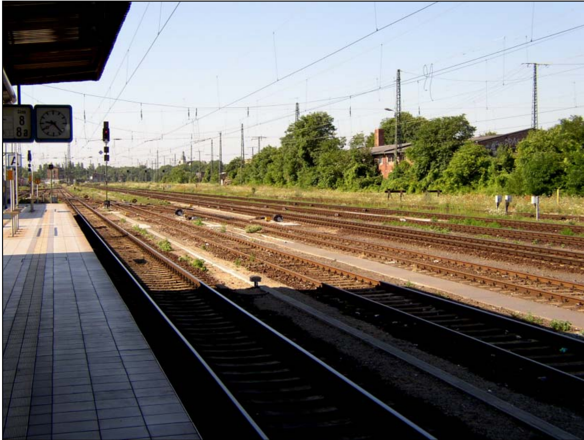
Abb.3: Blick von Gleis 8 des Hbf. Magdeburg nach Südwesten. Der unterschiedliche Aufwuchs auf den Flächen bzw. zwischen den Gleisen siegelt die heutige Nutzungsintensität gut wider. Der Gehölzstreifen dürfte weitgehend auf spontane Ansiedlung zurückzuführen sein.