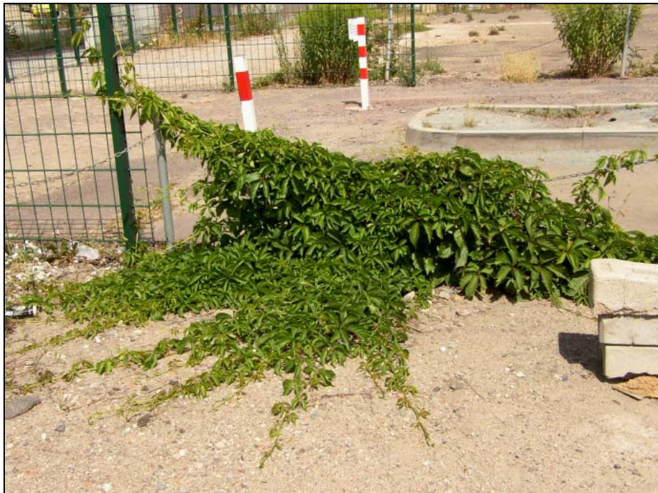
Abb. 15: Parthenocissus inserta auf ehemaligem Hauptbahnhofs Gelände an der Maybachstraße (Juli 2003).