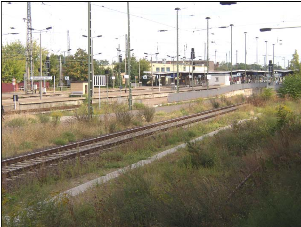
Abb. 6: Blick nach Nordwesten über das Bahnhofsgelände. Auf den ehemaligen Gleisflächen haben sich vor allem Dauco-Melilotion-Bestände mit Calamagrostis epigejos , Daucus carota , Picris hieracioides , Carduus acanthoides und Solidago canadensis entwickelt.