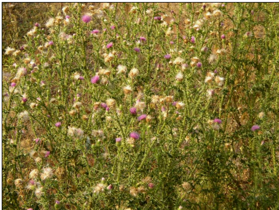
Abb. 8: Carduus acanthoides blühend und fruchtend (August 2003).