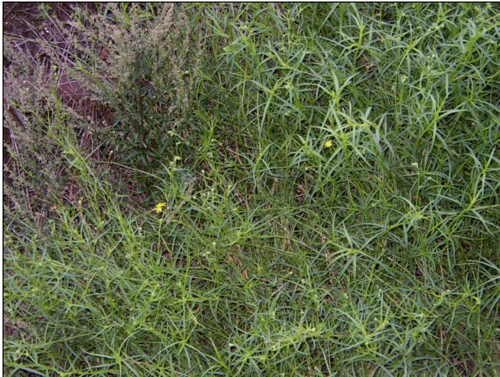
Abb. 10: Senecio inaequidens auf Gleisschotter im Halbschatten einer überdachten Laderampe. Die Individuen haben auffallend viele Blätter und beginnen Ende August/Anfang September erst zu blühen, während Pflanzen von voll besonnten Wuchsorten längst fruchten.